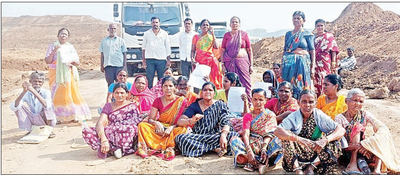
మర్రిగూడ, 2 మార్చి ప్రభాతవార్త:

మునుగోడు నియోజకవర్గం, మర్రిగూడ మండలం శివనగూడ(పర్లగూడ) ప్రాజెక్టు ముంపు గ్రామాల్లో భాగంగా నర్సి రెడ్డిగూడెం గ్రామస్తులు వలస వెళ్లిపోయారు. ఊరు ఊరందతా దిక్కు తోచనివిధంగా కంట నీరు పెట్టి తమ ఇంటి సామాన్లను పొరుగుగూడకు తరలించారు. తాత ముతాతలు సంపాదించిన ఆస్తులు ప్రాజెక్టు నిర్మాణంలో కను మరుగవు తండటంతో విలపిస్తూ వెళ్లిపోయారు. దీంతో ఊరు ఊరంతా ఖాళీ కావడంతో వల్లకాడులా తలపిస్తూ నిర్మాణవ్యయమైంది. నర్సి రెడ్డి గ్రామం పూర్తి స్థాయిలో నష్ట పరిహారం, ప్లాట్లు ఇప్పించాలంటూ పలుమార్లు అధికారులను, ప్రభుత్వాన్ని అడుగున్నారు. గత ప్రభుత్వ విధానాల వల్ల తమ ఆశలు అడియాశలు అయ్యాయంటూ కన్నీరు అయ్యారు. నర్సి రెడ్డి గూడెం గ్రామంలో మొత్తం 760 మంది జనాభా ఉండగా, 360 మంది ఓటర్లు ఉన్నారు. ఇందులో భాగంగా డిఎల్ఐఎస్ 151 కాదా, ఆర్ఆండ్ ఆర్ఆర్ కు చెందిన 289 కుటుంబాలు ఉన్నాయి. 18