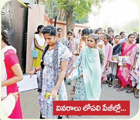
వివరాలు లోపలి పేజీల్లో...

ప్రశాంతంగా ఇంటర్ పరీక్షలు -ఉమ్మడి జిల్లా వ్యాప్తంగా ప్రారంభమైన పరీక్షలు