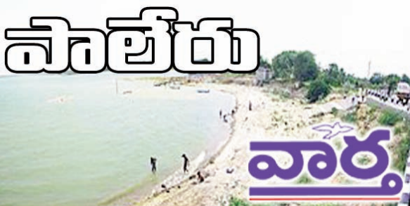
నేలకొండపల్లి, ఖమ్మం రూరల్, కూసుమంచి, తిరుమలాయాపాలెం