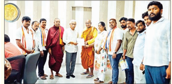
ఖమ్మం, కార్పొరేషన్, రఘునాథపాలెం, కల్లరల్, ఖమ్మం రూరల్

చేరుతాయని అన్నారు. నూతనంగా యూ.డి.ఐ.డి. కార్డు కోసం దరఖాస్తు చేసుకున్న వారికి ఆసుపత్రి లో స్టాట్ బుకింగ్ చేసి సమాచారం అందించాలని, నిర్ధారణ పరీక్షలు నిర్వహించిన తర్వాత యూ.డి.ఐ.డి. కార్డు జనరేట్ చేస్తామని అన్నారు. యూ.డి.ఐ.డి. పోర్టల్ లో కొత్త వ్యాధులను కూడా చేర్చడం జరిగిందని అన్నారు. ఆన్ లైన్ లో దరఖాస్తు చేసుకున్న తర్వాత మన ఫోన్ కు మెడికల్ క్యాంపు సమాచారం మెసేజ్ ద్వారా అందుతుందని, ఖమ్మం జిల్లాలోని దివ్యాంగులకు నేరుగా ఫోన్ చేసి ఏ ఏ పత్రాలు తీసుకొని రావాలి సమాచారం అందించేలా వ్యవస్థ ఏర్పాటు చేస్తామని అన్నారు. మెడికల్ క్యాంపులో వైకల్యం నిర్ధారించిన తర్వాత సదరు వివరాలను వైద్యులచే ధృవీకరించి వివరాలు ఆన్ లైన్ లో నమోదు చేసి యూ.డి.ఐ.డి. కార్డు అందేలా చర్యలు తీసుకుంటామని అన్నారు. ఖమ్మం జిల్లాలో జారీ చేసిన సదరం సర్టిఫికెట్ లలో కొన్నింటిలో వైద్యుల సంతకాలు మిస్ కావడం వల్ల దివ్యాంగులు ఇబ్బందులు గురవుతున్నారని తెలుపగా, వాటికి కూడా యూ.డి.ఐ.డి. కార్డు జారీ చేసేలా చర్యలు తీసుకుంటామని కలెక్టర్ అన్నారు. స్థానిక సంస్థల అదనపు కలెక్టర్ మాట్లాడుతూ.. దివ్యాంగులకు సదరం సర్టిఫికెట్లకు బదులుగా యూనిక్ డిజిటలైజేషన్ ఐడి కార్డులు జారీ చేయడం జరుగుతుందని, ఇవి ఇతర రాష్ట్రాలలో కూడా ఉపయోగపడతాయని అన్నారు. నూతనంగా యూ.డి.ఐ.డి. కార్డుల కోసం ఆన్ లైన్ లో దరఖాస్తు చేసుకోవచ్చని, సదరం సర్టిఫికెట్ ఉన్నవారికి జిల్లా గ్రామీణ అభివృద్ధి శాఖ అధికారి ద్వారా యూ.డి.ఐ.డి. జనరేట్ చేయడం జరుగుతుందని తెలిపారు. ఈ అవగాహన సదస్సులో డిఆర్వో ఏ. పద్మశ్రీ, జెడ్పీ సిఐఓ డిక్షా రైనా, డిఆర్టీవో సన్యాసయ్య, జిల్లా సంక్షేమ అధికారి కె. రాంగోపాల్ రెడ్డి, డిఐఓ సోమశేఖర శర్మ, అధికారులు, తదితరులు పాల్గొన్నారు.