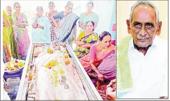
తల్లాడ, మార్చి 06, ప్రభాతవార్త