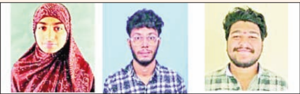
నేలకొండపల్లి, మార్చి 6 ప్రభాతవార్త: