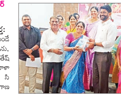
కలెక్టర్ మాట్లాడారు... ముందుగా మహిళలు అందరికీ మహిళా దినోత్సవ శుభాకాంక్షలు తెలిపారు. మహిళల సమానత్వం మన ఇంటి నుండే ప్రారంభం కావాలన్నారు. ఇంట్లో ఆడపిల్లలను, మగ పిల్లలను సమానంగా చూడాలని సమానంగా చదివించాలని సూచించారు. సమాజంలో మహిళలకు సమాన