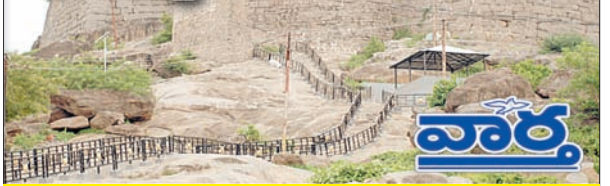
ఖమ్మం, కార్పొరేషన్, రఘునాథపాలెం, కల్లరల్, ఖమ్మం రూరల్