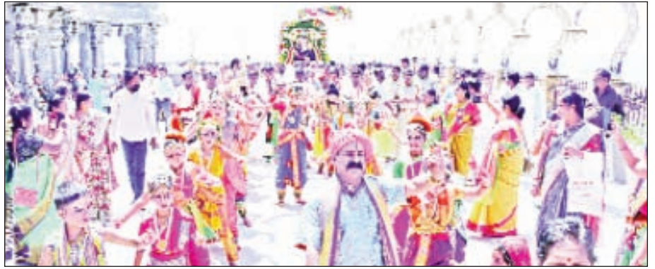
-అశ్వ వాహన శేవ, ఎదుర్కోలు ఉత్సవము ప్రత్యేకత

జగత్ రక్షకుడైన స్వామి వారి లీలల విశేషలు అద్భుతం. స్వామి వారు తన జగన్మోహన లీలా విలాసమును తెలియజేస్తూ లోకోత్తరమైన సౌందర్యాన్ని ఆకర్షణ శక్తిని కలిగిన జగన్మోహిని అలంకారములో భక్తులకు దర్శనభాగ్యము కలిగించారు. స్వామివారు క్షీరసాగర మథనము జరిగే సమయంలో, శ్రీహరి జగన్మోహినిగా అవతరించి రాక్షసులను తన మాయామోహ పరవశంలో పడవేస్తూ, దేవతలకు అమృతమును అందించిన తీరు ఎంతో మనోహరము. జగత్తు అంతా మాయా మోహముని, ఎవరైతే మోహమును త్యజిస్తారో వారికి అమృతత్వము అందిస్తున్న స్వామి వారు జగన్మోహిని అలంకారంలో దర్శనమిచ్చారు.