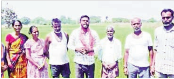
ప్రభుత్వానికి పట్టవాని ప్రశ్నించారు. వెంటనే కాల్యాల పనులు ప్రారంభిస్తే బాగుంటుందని లేకపోతే రైతుల ప్రజా ఆగ్రహానికి బీర్ల ఐలయ్య గురికాక తప్పదు అన్నారు.

రాజాపేట ప్రాంతం నుండి సాగునీరు మండల ప్రజలకు అవసరపడకుండా ముందుకు వెళ్లడం, మండలంలో పంటలు అడ్డగోలుగా ఎండిపోవడం కు బాధ్యుడైన ప్రభుత్వ విప్ బీర్ల ఐలయ్య వెంటనే పదవికి రాజీనామా చేయాలని టిఆర్ఎస్ జిల్లా నాయకులు డిమాండ్ చేశారు. శనివారం ఆయన రైతులతో కలిసి ఎండిన పంట పొలాల వద్ద మీడియా సమావేశం నిర్వహించారు. ఎన్నికల ముందు ఇచ్చిన ప్రకారం కాలేశ్వరం ద్వారా మండలానికి గొలుసు కట్టు చెరువులను నింపే కార్యక్రమాన్ని ప్రారంభించలేదని అన్నారు. రైతుల కష్టాలు ఆత్మహత్యలకు కాంగ్రెస్ తప్పదు అన్నారు.