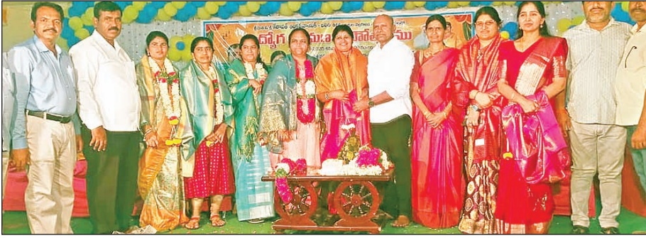
మిర్యాలగూడ, మార్చి 8 ప్రభాతవార్త