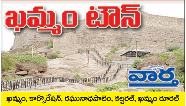
ఖమ్మం, కార్పొరేషన్, రఘునాథపాలెం, కల్లరల్, ఖమ్మం రూరల్