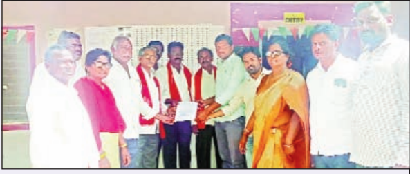
నేలకొండపల్లి, మార్చి 10 ప్రభాతవార్త: