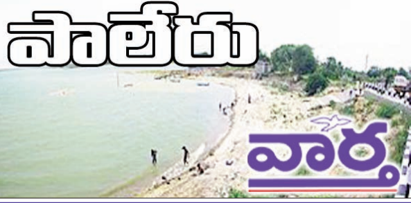
నేలకొండపల్లి, ఖమ్మం రూరల్, కూసుమంచి, ఆరుమలాయపాలెం

ఆరాధన, యాగశాల ఆరాధనలు, అగ్ని ఆరాధన, శ్రీసుదర్శన హవనము, పూర్ణాహుతి, నివేదన, బలిహారణము, తీర్థప్రసాద వితరణ, యాగశాల ఆరాధనలు, అగ్ని ఆరాధన, పూర్ణాహుతి, బలిహారణము, సాయంత్రం 7గంటలకు తీరుక్కిణి, సత్యభామ సమేత శ్రీరాజగోపాల స్వామి తిరుకళ్యాణ మహోత్సవం జరుపనున్నట్లు వారు చెప్పారు. 15వ తేదీన సుప్రభాతము, నిత్య ఆరాధన, యాగశాల ఆరాధనలు, అగ్ని ఆరాధన, మహాపూర్ణాహుతి, చక్ర స్నానము, నివేదన, తీర్థప్రసాద వితరణ, శ్రీపుష్పయాగము, ద్వాదశ ఆరాధనలు, దేవతోద్వాసనము, సప్తావరణ ములు, ధ్వజ అవరోహణము, నివేదన, వేద ఆశీర్వాచనము, ఏకాంతసేవ, తీర్థప్రసాద వితరణ జరుపనున్నట్లు వారు చెప్పారు. భక్తులు అందరూ శ్రీస్వామి వారి బ్రహ్మోత్సవవాలను తిలకించి, సేవించి, శ్రీస్వామి వారి కృపకు పాత్రులు కావాలని వారు కోరారు.