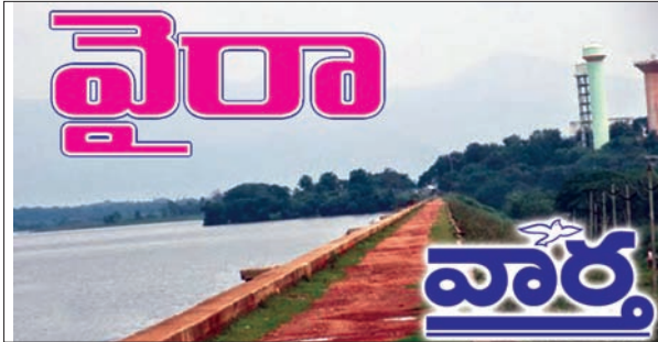
కారేపల్లి, వైరా, కొణిజర్ల, ఏన్నూరు

వాహనదారులు వర్షాకాలం ఇబ్బందులు పడుతున్నా ఎవరూ పట్టించుకోకపోవడం విచారకరం. వర్షాకాలంలో భారీ వర్షాలు కురుస్తుండటంతో వాగు పక్కనే గల డబుల్ బెడ్రూం లబ్బిదారులు ఇబ్బంది పడుతున్నారు. ఇకపోతే లోలెవల్ బ్రిడ్జి ప్రక్కనేబుగ్గవాగుసమీపంలోనే డబుల్ బెడ్ రూం ఇళ్ల లబ్బిదారులకు ఇళ్ల నిర్మాణం పూర్తి చేసి అప్పగించారు. దీంతో ప్రతి ఏడాది సంబంధిత లబ్బిదారులను సురక్షిత ప్రాంతానికి తరలించే క్రమంలో అధికారులు అప్రమత్తం అవుతారు. ఇన్ని సమస్యలు ఎదుర్కొంటున్న ఈ ప్రాంతంలో హై లెవల్ బ్రిడ్జి ఏర్పాటు అవసరం ఎంతైనా ఉంది. దీనికి సంబంధించి పలుమార్లు స్థానిక ఎంఎల్ఎ ప్రజాప్రతినిధులకు ఈ ప్రాంత ప్రజలు విజ్ఞాపన పత్రాలుకూడా అందజేశారు. ఇప్పటికైనా బాదిత గ్రామాల ప్రజలకు అందుబాటులో ఉండేవిధంగా డిప్యూటీ సీఎం భట్టి విక్రమార్క జిల్లా మంత్రులు పొంగులేటి శ్రీనివాస్ రెడ్డి తుమ్మల నాగేశ్వరరావు లు జోక్యం చేసుకుని బ్రిడ్జినిర్మాణానికి సహకరించాలని స్థానికులు కోరుతున్నారు..