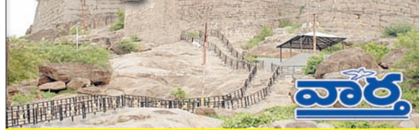
ఖమ్మం, కార్పొరేషన్, రఘునాథపాలెం, కల్లరల్, ఖమ్మం రూరల్