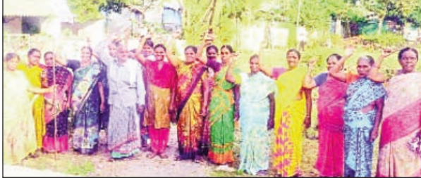
కారేపల్లి మార్చి 12 ప్రభాతవార్త

మహిళా అణచివేతపై బలమైన ఉద్యమం సమాన హక్కులంటున్న సమస్యలు వేధిస్తున్నాయి