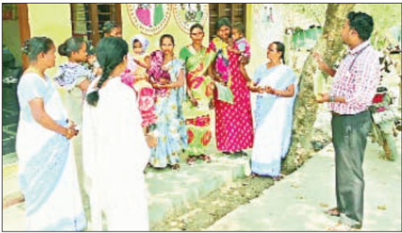
వీటూరునాగారం రూరల్, మార్చి 12, ప్రభాతవార్త :

కొండా యువవనంపాతాళి పరిధిలో గొత్తి కోయగూడెంలో ప్రజలు వేసవి కాలంలో అప్రమత్తంగా ఉండాలని కొండా యువవనంపాతాళి హెచ్చరికలు చేసింది. అప్రమత్తంగా ఉండాలని కొండా యువవనంపాతాళి హెచ్చరికలు చేసింది. అప్రమత్తంగా ఉండాలని కొండా యువవనంపాతాళి హెచ్చరికలు చేసింది.