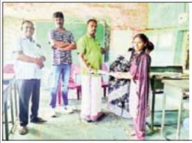
నడిగూడెం, మార్చి 12, ప్రభాతవార్త: