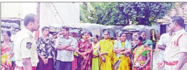
మునగాల మార్చి 12 ప్రభాతవార్త