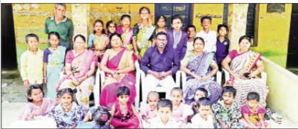
మునగాల మార్చి 12 ప్రభాతవార్త