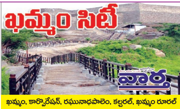
ఖమ్మం, కార్పొరేషన్, రఘునాథపాలెం, కల్లరల్, ఖమ్మం రూరల్