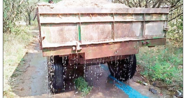
అక్రమార్కులపై కొరడా రులిపించాలని సాక్షాత్తు జిల్లా కలెక్టర్, రాచకొండ పోలీసు కమీషనర్ సృష్టమైన ఆదేశాలను జారీ చేసినా జిల్లాలో మాత్రం అక్రమ ఇసుక రవాణాకు అడ్డుకట్ట పడడం లేదు. ఇప్పటికైనా సంబంధిత అధికారులు స్పందించి ప్రభుత్వాలకు చెల్లించాల్సిన రాయల్టీని ఎగవేయడంతో పాటు వాల్టా చట్టాన్ని తుంగలో తొక్కుతూ జోరుగా ఇతర ప్రాంతాలకు ఇసుక అక్రమ రవాణాను నిరోధించకపోతున్నా సంబంధిత అధికారులపై ఏ మేరకు కొరడా రులిపిస్తారో వేచి చూడాల్సిందే.