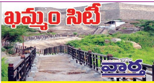
ఖమ్మం, కార్పొరేషన్, రఘునాథపాలెం, కల్లరల్, ఖమ్మం రూరల్