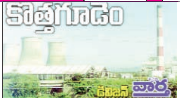
చుంచుపల్లి, జూలూరుపాడు, సుజాతనగర్