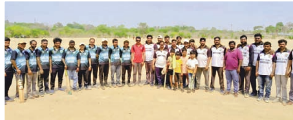
మణుగూరు, ప్రభాతవార్త, మార్చి 16: