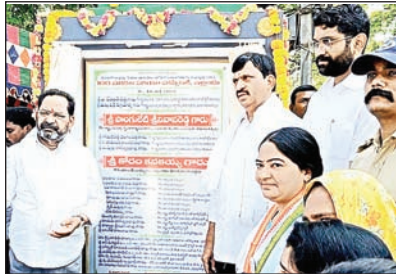
చేశారు. ప్రభుత్వానికి ప్రజల్లో వస్తున్న ఆదరణ

చూసి ఓర్వలేక బీఆర్ఎస్ చేస్తున్న అసత్య ఆరోపణలు సరికాదని సూచించారు. గత బిఆర్ఎస్ ప్రభుత్వ హయాంలో ప్రజలకు ఇచ్చిన హామీలను నెరవేర్చకుండా మోసం చేశారని ఆరోపించారు. పైగా రాష్ట్రాన్ని అప్పుల ఊబిలో పడవేసిన ఘనత ఒక్క బిఆర్ఎస్ ప్రభుత్వానికే దక్కుతుందన్నారు. బిఆర్ఎస్ ప్రభుత్వ అప్పుల వల్ల తమ ప్రభుత్వం అనేక ఇబ్బందులు పడుతూ అభివృద్ధి, సంక్షేమ పథకాలను కొనసాగిస్తున్నదని తెలిపారు. ప్రాజెక్టుల పేరుతో రూ. లక్షల కోట్ల ప్రజాధనాన్ని గత ప్రభుత్వం దుర్వినియోగం చేసిందని విమర్శించారు. పేదలలో నిరుపేదలకు ఇందిరమ్మ ఇండ్ల మంజూరు చేస్తున్నామన్నారు. రాబోయే కాలంలో 20 లక్షల ఇందిరమ్మ ఇండ్లను కట్టి తీరుతామని ధీమా వ్యక్తం చేశారు. అంతర్జాతీయ ప్రమాణాలతో యంగ్ ఇండియా ఇంటిగ్రేటెడ్ పాఠశాలల స్థాపనకు 58 నియోజకవర్గాలలో రూ. 11,600 కోట్ల మంజూరు చేసినట్లు తెలిపారు. ఇందిరమ్మ రాజ్యంలో అన్ని వర్గాలకు సమన్వయం చేయడం జరుగుతుందని తెలిపారు. ఇల్లందు మండలంలోని పూజెల్లి గ్రామంలో మంజూరైన 83 ఇందిరమ్మ ఇండ్ల నిర్మాణ పనులను ప్రారంభించి భూమి పూజ నిర్వహించామని తెలిపారు. పూజెల్లి గ్రామం నందు శంకుస్థాపన చేసి సుమారు 83 ఇళ్లను సైలెంట్ ప్రాజెక్టుకింద అందించడం సంతోషకరమన్నారు. ఇందిరమ్మ ఇండ్ల నిర్మాణాల్లో నాణ్యత ప్రమాణాలు పాటించాలని సూచించారు. కేంద్ర ప్రభుత్వం ఎన్ని అడ్డంకులు