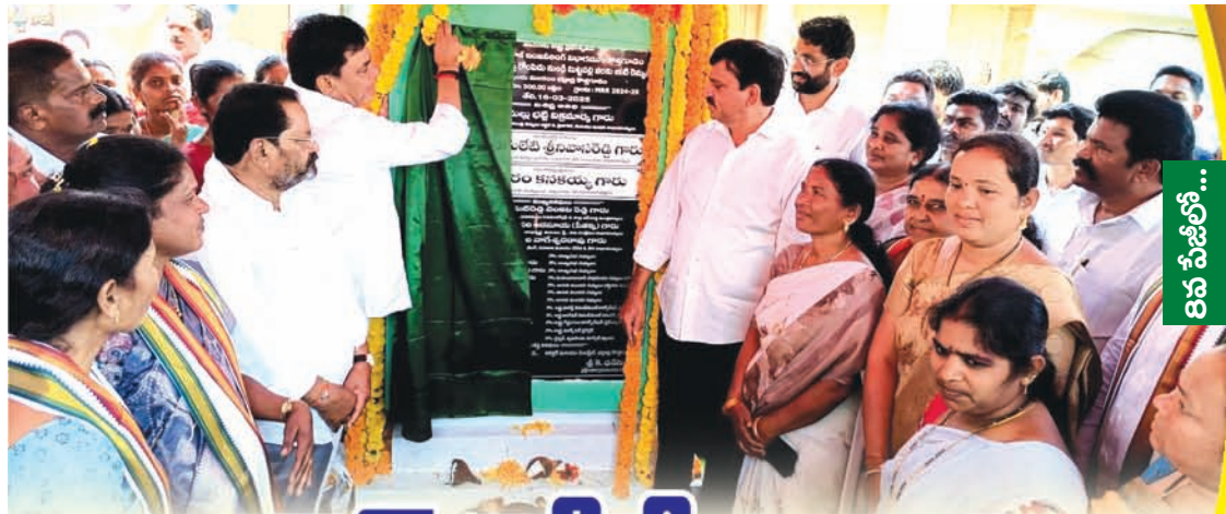
16లో.. రామాలయం ఈవో

దేవస్థాన ఈవో వివరణ ఆదివారం అర్చకస్వాములు పాతికేయులకు విడుదల చేసిన వీడియోపై దేవస్థాన కార్యనిర్వహణాధికారిను ప్రభాతవార్త వివరణ కోరగా ... ఒక పత్రికలో అర్చకులపై అభ్యంతరకరంగా వచ్చిన వార్తపై ఖండన ఇస్తున్నామని తెలియజేశారని అన్నారు. శ్రీరామనవమి ఉత్సవాల దృష్ట్యా ఏర్పాట్లలో నిమగ్నమైన కారణంలో అర్చకులు వీడియోలో ఏం మాట్లాడారో చూడలేదని బదులిచ్చారు. భద్రాద్రి దేవస్థానంలో ఏం జరుగుతుందో జిల్లా కలెక్టర్, దేవాలయ శాఖ ప్రిన్సిపల్ సెక్రటరీ, రాష్ట్ర మంత్రులు గమనిస్తున్నారని, ఉత్సవాల అంకురార్పణ కార్యక్రమం ఎందుకు ఆలస్యం అయినదో సాక్షాత్తు శ్రీరాముడికే తెలుసునని అన్నారు.