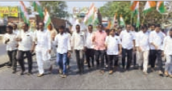
తల్లాడ, మార్చి 16, ప్రభాతవార్త