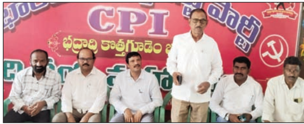
మణుగూరు, ప్రభాతవార్త, మార్చి 16: