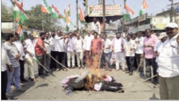
సత్తుపల్లి మార్చి 16 ప్రభాతవార్త: