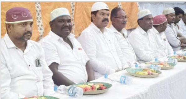
మణుగూరు, ప్రభాతవార్త, మార్చి 16: