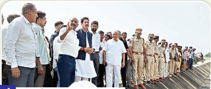
8లో.. జాతీయ ఎన్టీ కమిషన్ సభ్యుడు జాట్ హుస్సేన్

ముగ్గురు... మంత్రులున్న ప్రాజెక్టుకు నిధులు తీసుకురా పోవడం సిగ్గుచేటు