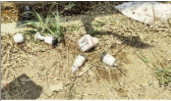
- అర్ధరాత్రి గేదల డైరీ ఫామ్పై దాడి చేశారు