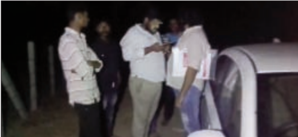
దాడి చేసేందుకు వచ్చిన వ్యక్తులు