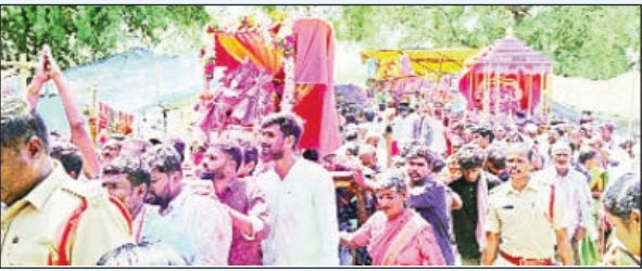
మునగాల మార్చి 17 ప్రభాతవార్త

మండల పరిధిలోని రేపాల గ్రామంలో స్వయంభుగా వెలసినశ్రీ రేపాల లక్ష్మీ నరసింహ స్వామి బ్రహ్మోత్సవాల్లో భాగంగా సోమవారం స్వామివారి అమ్మవార్లకు వేలాది భక్తులను సమక్షంలో గంధోళి వసంతోత్సవ కార్యక్రమాన్ని ఆలయ కమిటీ ఆధ్వర్యంలో అంగరంగ వైభవంగా నిర్వహించారు. స్వామివారి వసంతోత్సవ కార్యక్రమంలో భాగంగా రేపాల గ్రామంలోని పురపీఠుల్లో పల్లకిలో ఊరేగుతుండగా పెద్ద ఎత్తున భక్తులు రంగులు చల్లుకుంటూ గంధోళి వసంతోత్సవ వేడుకల్ని అంగరంగ వైభవంగా వేలాదిమంది భక్తులను సంబరల్లో పాల్గొన్నారు.