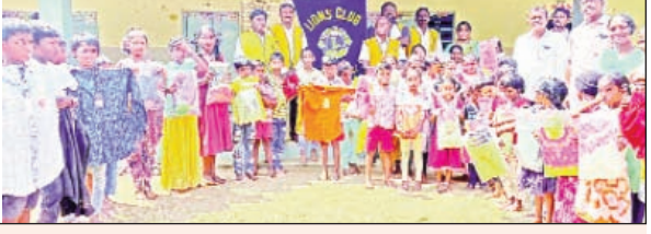
నేరేడుచర్ల మార్చి 17 ప్రభాతవార్త