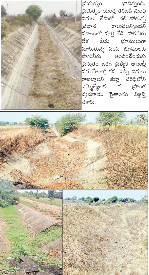
ప్రభుత్వం భావిస్తుంది. ప్రభుత్వం యేండ్ల తరబడి నుంచి నిధుల లేమితో నలిగిపోతున్న ప్రధాన కాలువలన్నింటినీ సకాలంలో పూర్తి చేసి సాగునీరు లేక బీడు భూములుగా మారుతున్న పంట భూములకు సాగునీరు అందించేందుకు ప్రస్తుతం జరిగే ప్రత్యేక అసెంబ్లీ సమావేశాల్లో గతం విప్పి నిధులు రాబట్టాలని జిల్లా పరిధిలోని ఎమ్మెల్యేలకు ఈ ప్రాంత వ్యవసాయ రైతాంగం విజ్ఞప్తి చేశారు.