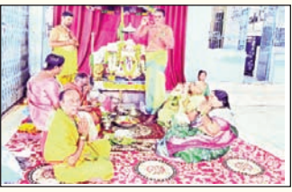
మతంపల్లి, మార్చి 17 ప్రభాతవార్త: