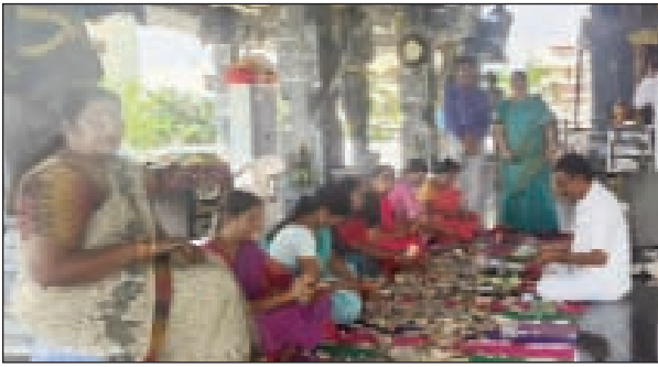
పాల్వంచ టౌన్, మార్చి 18 - ప్రభాతవార్త: