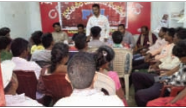
దమ్మపేట, మార్చి 18 ప్రభాతవార్త: