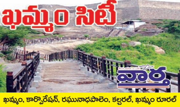
ఖమ్మం, కార్పొరేషన్, రఘునాథపాలెం, కల్లరల్, ఖమ్మం రూరల్