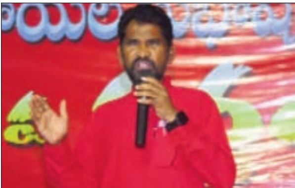
పాల్వంచ టౌన్, మార్చి 18 - ప్రభాతవార్త:

భారత రాజకీయరంగంలో దిశి(లీలి) ఏర్పాటు ఒక చారిత్రక అవసరంగా ముందుకు వచ్చిందని, మార్క్సిస్టు మహోపాధ్యాయుడు కామ్రేడ్ లెనిన్ జన్మదినం రోజునే పురుషోసుకుని అవుసూరి మడు అన్నారు. అర్ధవల, అర్ధ భూస్వామ్య దేశంలో దున్నేవానికే భూమి నినాదంతో వ్యవసాయక విప్లవం ఇరుసుగా నూతన ప్రజాస్వామిక విప్లవాన్ని విజయవంతం చేయాలనే అవగాహనను ప్రజలకు అందించింది. బడా భూస్వామ్య, బడా పెట్టుబడిదారీ విధానం, సామ్రాజ్యవాదం ఈ మూడు కలగలిసిన కూటమికి భారత ప్రజలకు ప్రధాన వైరుధ్యం ఉందని స్పష్టపరిచింది. ఈ అవగాహనతోనే విప్లవకారులు సాయుధ పోరాట పంథా ఎంచుకున్నారు. విప్లవోద్యమాన్ని నిర్మించారు. ఉమ్మడి ఆంధ్ర రాష్ట్రంలో సిపిఎం రివిజనిజంతో తెగతెంపులు చేసుకుని తక్షణ కార్యక్రమాన్ని రూపొందించి పూర్వోత్తర ప్రాంతాలను, క్యాడర్ని ఎన్నిక చేసుకున్నారు. నక్కల్పూరి, శ్రీకాకుళం నేపథ్యంలో ఆనాటి ఆంధ్రలోని ఖమ్మం జిల్లా పగడేరులో భూస్వాముల ఇళ్లపై దాడులు చేసి ఆయుధాలు స్వాధీనం చేసుకుని సాయుధ పోరాటం ప్రారంభమైందని ప్రకటించారు. ఇది అతివాద చర్య. దీనిని సరిదిద్దుకుంటూ ఆత్మరక్షణ సాయుధ పోరాటంగా, అనంతరం ప్రతిఘటన పోరాటంగా అభివృద్ధి చేసుకోవడం జరిగింది. ఆచరణలో ప్రజలను ప్రజాయుద్ధపంథా వైపు నిలబెట్టుకోవడంలో గొప్ప కృషి జరిగిందని అన్నారు. అతివాదం పేరుతో చరిత్రని రైతాంగ సాయుధ పోరాటాలని, పోరాట అనుభవాలను పూర్తిగా తిరస్కరిస్తున్నారు. ఏ పంథాలో విజయం సాధించగలమో ముందుగా నిర్ణయించడం శుభ్య సైద్ధాంతికవాదం అవుతుందంటూనే భారత విప్లవ పంథా ప్రజాయుద్ధ పంథా కానే కాదని నిర్ణయంగా ప్రకటించారు. మస్ లైన్ వారు పార్లమెంటురిజం వైపు ప్రయాణించడానికి కప్పుకున్న ముసుగిది. దీనిని ప్రజలు పార్టీ శ్రేణులు విప్లవ అభిమానులు అర్థం చేసుకోవాలని కోరుతున్నాను.