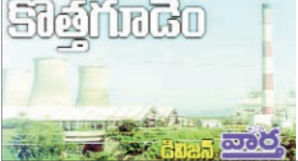
చుంచుపల్లి, జాలూరుపాడు, సుజాతనగర్