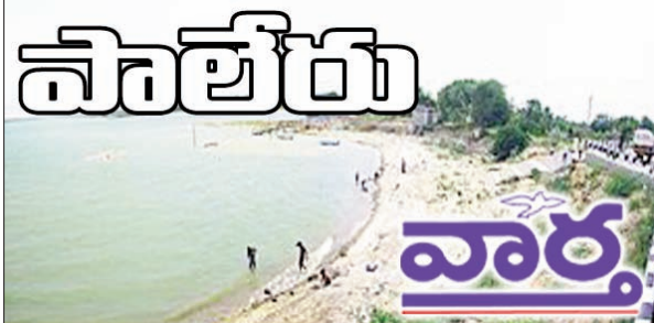
నేలకొండపల్లి, ఖమ్మం రూరల్, కూసుమంచి, ఆరుమలాయపాలెం