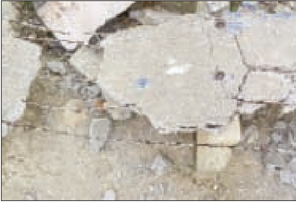
లక్ష్మీదేవిపల్లి, మార్చి 18 - ప్రభాతవార్త:

మండలంలోని హేమచంద్రాపురం ప్రభుత్వ ప్రాథమిక పాఠశాలలో మందుబాబులు వీరంగం సృష్టించారు. పాఠశాల తలుపులు పగలగొట్టి టేబుల్‌లోని పుస్తకాలు చిందరవందర పడేశారు. ఇటీవల కాలంలో