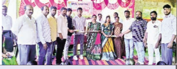
రాజుపేట, మార్చి 19 ప్రభాతవార్త

రాజుపేట మండలం చల్లురు ఉన్నత పాఠశాలలో ప్రధాన ఉపాధ్యాయుల అధ్యక్షతన బుధవారం 10 వ, తరగతి చదువుతున్న విద్యార్థిని విద్యార్థులకి వీడోలు నిర్వహించిన సందర్భంగా ప్రజా సేవ సమితి సభ్యులు విద్యార్థులకు అల్ దా బెస్ట్ చెప్పుతూ వారికి వార్షిక పరీక్షలకు అవసరం అయ్యే పరీక్షా సామాగ్రిని అందజేశారు. ఈ కార్యక్రమం లో సేవా సమితి సభ్యులు మాట్లాడుతు విద్యార్థులు 100!! ఉత్తీర్ణత సాధించి, 10/10 జీపీఎ సాధించాలని భవిష్యత్తు లో వారు మంచి ఉన్నత చదువులు చదివి ఉద్యోగాలు పొందాలని సూచించారు. ఉపాధ్యాయులు, ప్రజా సేవ సమితి సభ్యులు, యాత్ సభ్యులు, విద్యార్థిని విద్యార్థులు పాల్గొన్నారు.