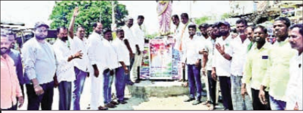
తుర్కపల్లి, మార్చి 19 ప్రభాతవార్త