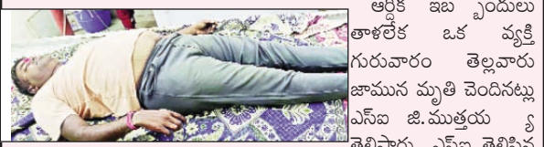
హజూర్ నగర్ టౌన్ మార్చి 20 ప్రభాతవార్త