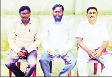
వేతనాలు తక్కువే చెల్లించాలని ఆశ వర్కర్లకు ఫిక్స్ డ్ వేతనం 18 వేల తో పాటు టార్గెట్ లాంటి సమస్యలపై ఉద్యమాలు చేస్తున్నారని దీనితో రాష్ట్ర ప్రభుత్వం వారితో వర్కలు జరిపి పరిష్కారానికి ఐఎఎస్ అధికారులతో కమిటీ వేసి ఆ ప్రతిపాదన ఆధారంగా చర్యలు తీసుకుంటామని ప్రకటించినప్పటికీ అమలకు నోచుకోలేదని, ఎన్నికల సందర్భంగా ఇచ్చిన హామీలను అమలు చేయాలని డిమాండ్ చేశారు

ఎన్నో ఆశలు పెట్టుకున్న అంగన్వాడీ ఆశలన్ని ఒక్కొక్కటిగా ఆవిరి అవుతున్నాయని ఆందోళన వ్యక్తం చేశారు. విద్యా విధానంలో కేంద్ర ప్రభుత్వం అడుగుజాడల్లోనే రాష్ట్ర ప్రభుత్వం నడవడం విచారకరమని అన్నారు కేంద్రంలో అధికారంలో ఉన్న ఎన్డీఎ ప్రభుత్వం ఐసిడిఎస్ పథకాన్ని ఫ్రైవేటీకరణ చేసేందుకు అన్ని రకాల ప్రయత్నాలు చేస్తుందని అందులో భాగంగానే జాతీయ విద్యా విధానాన్ని కేంద్ర ప్రభుత్వం అమలు చేస్తుందని పీఎం శ్రీ పథకాన్ని రాష్ట్రంలోని దాదాపు అన్ని జిల్లాలలో శ్రీకారం చుట్టించింది. మొబైల్ అంగన్వాడీ పేరుతో కొత్త విధానాన్ని తెస్తుందని దీనివల్ల ప్లమ్ ఏరియాలో ఉన్న పేద పిల్లలకు అంగన్వాడీ సేవలకు దూరం అవుతారని ఆయన ఆందోళన వ్యక్తం చేశారు. అంగన్వాడీ వర్కర్లకు రావాల్సిన 10 నెలల