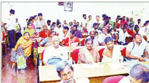
పిడి రాజకుమార్, జిల్లా అధికారులు ఈ ప్రజావాణి కి హాజరయ్యారు.