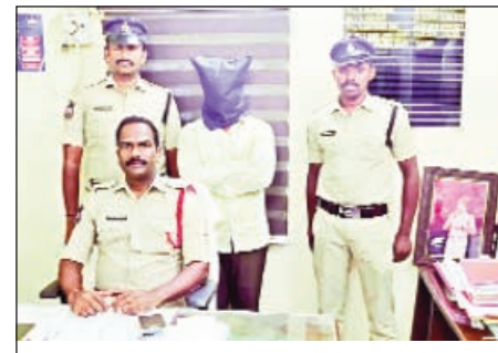
మని సిపిఐ హెచ్చరించారు.