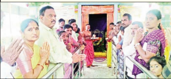
హుజూర్ నగర్ రూరల్, మార్చి 22, ప్రభాతవార్త: