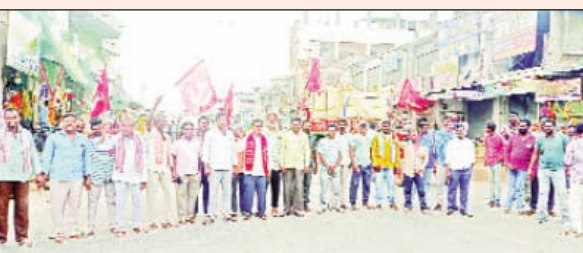
నేరేడుచర్ల, మార్చి 22 ప్రభాతవార్త