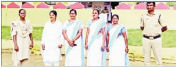
నడిగూడెం, మార్చి 24, ప్రభాతవార్త: