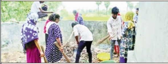
గరిడేపల్లి, మార్చి 24, ప్రభాతవార్త :