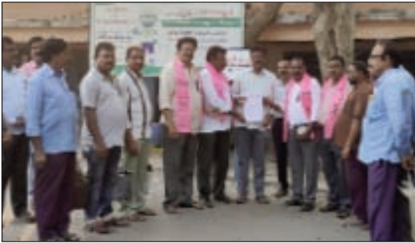
కొత్తగూడెం ఏరియాలో నూతనంగా ప్రారంభం కానున్న వి.కే.ఓ.సి