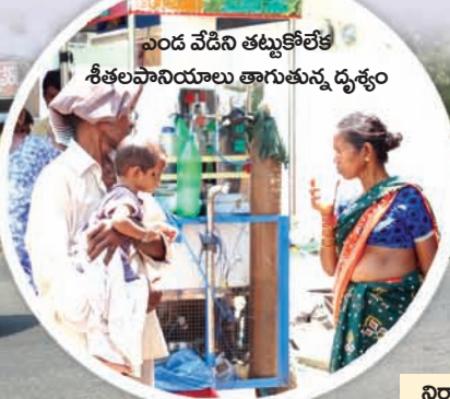
ఎండ వేడిని తట్టుకోలేక శీతలపానీయాలు తాగుతున్న దృశ్యం