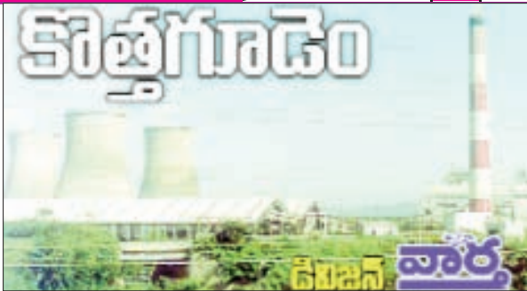
చంచుపల్లి, జూలూరుపాడు, సుజాతనగర్