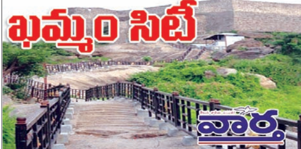
ఖమ్మం, కార్పొరేషన్, రఘునాథపాలెం, కల్లరల్, ఖమ్మం రూరల్