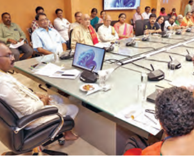
విజయవాడ, మార్చి 18 ప్రభాతవార్త: అనందంలో ఉన్నవారు ఎవరైనా సరే వారిని ఆదుకోని

దర్శకులతో సమావేశమయ్యారు. ఈ సందర్భంగా ఐ. మాట్లాడుతూ అన్నమయ్య కీర్తనల కీర్తనలలో ఇప్పటివరకు 14,932 కీర్తనలను టిటిడి అందుబాటులోకి తీసుకువచ్చిందిన్నారు. ఇందులో 4,750 కీర్తనలను ఎస్సీ రికార్డింగ్ ప్రాజెక్టు రికార్డు చేసి 4,610 కీర్తనలను టిటిడి వెబ్సైట్లో పొందుపరచామన్నారు. మొదటి దశలో 290 కీర్తనలను 29 సిడిలను పూర్తిచేయగా, రెండోదశలో 210 కీర్తనలను 21 సిడిలను రూపొందించారు