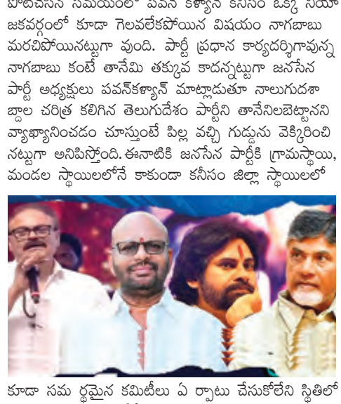
కూడా సమ రైతుల కమిటీలు ఏర్పాటు చేసుకోలేని స్థితిలో జిల్లా, రాష్ట్ర స్థాయిలోనే కాకుండా విపరీత బూత్ లెవల్ కమిటీలతో నిర్మాణాత్మకంగా ఎంతో పటిష్టంగా పున్న తెలుగుదేశం పార్టీని తానే నిలబెట్టాలని ప్రకటింపకపోతే పార్టీని నిలబెట్టాలని చెప్పాలి. తెలుగుదేశం పార్టీ నిలబెట్టడానికి ముందు తన అన్న లింగంపై ప్రారంభించిన ప్రజాశాస్త్రం పార్టీని నిలబెట్టాలి. తన అన్న లింగంపై ప్రజాశాస్త్రం పార్టీని నిలబెట్టాలి. తన అన్న లింగంపై ప్రజాశాస్త్రం పార్టీని నిలబెట్టాలి. తన అన్న లింగంపై ప్రజాశాస్త్రం పార్టీని నిలబెట్టాలి.