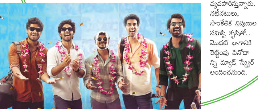
వ్యవహరిస్తున్నారు. నటీనటులు, సాంకేతిక నిపుణుల సమిష్టి కృషితో.. మొదటి భాగానికి రెట్టింపు విరోధాన్ని మ్యూడ్ స్టేజర్ అందించనుంది.

కి తిరిగి స్వాగతం పలకడానికి సరైన గీతం అన్యుట్టుగా వచ్చాలోయే ఎంతో ఉత్సాహంతో ఉంది. లద్దు గానీ పెళ్లి, స్వాతి రెడ్డి పాటలు బాలబోనే.. వచ్చాలోయే కూడా విడుదలైన సినిమాల్లోనే శ్రోతల అభిమాన గీతంగా మారిపోయింది. సంగీత సంపదనం భీమ్ సినిమాలోని స్వరపరచి, ఈ పాటను స్వయంగా ఆకట్టుకొని సినిమాపై అంచనాలు పెట్టినట్లు చెప్పింది. టీజర్ లోని సంభాషణలు సామాజిక మాధ్యమాల్లో తెగ చక్కర్లు కొడుతున్నాయి. అలాగే మ్యూడ్ స్టేజర్ నుంచి విడుదలైన లద్దు గానీ పెళ్లి, స్వాతి రెడ్డి పాటలు కూడా మారుమోగిపోతున్నాయి. తాజాగా ఈ చిత్రం నుంచి మూడో గీతం వచ్చాలోయే విడుదలైంది. మ్యూడ్ గ్యాంగ్