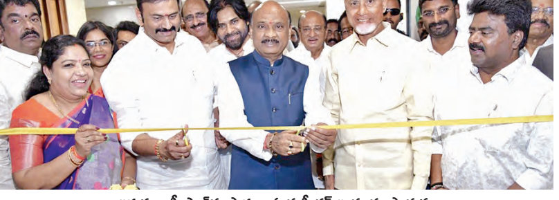
అరకు కాఫీ స్టాల్ను ప్రారంభించిన స్టీకర్ అయ్యన్న పాత్రుడు

ప్రారంభించిన స్టీకర్ అయ్యన్నపాత్రుడు, పాల్గొన్న సింఠి, డిప్యూటీ సింఠి, మంత్రులు