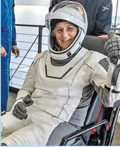
నింగి నుంచి నేలకు బిగి వచ్చిన! అంతరిక్షంలో నడిచిన తొలి మహిళా వ్యోమగామిగా నిలిచారు సునీత జలా మన కోరుకున్న రంగంలో అడుగుపెడితే ఇతరులందరినీ తన కెరీర్ విజయాలతో నిరూపించారే స్పెస్ డమ్మీ. సవాళ్ల సోపానాలు! ఎక్కడికైనా వెళ్లి నిర్ణయించుకున్నా తిరిగి రాకపోతే మనసంతా అలాగే ఉంటుంది. గతేడాది జూన్ లో అంతరిక్షంలో అంతరిక్ష కేంద్రం (బిఎస్సీ)లో వారం రోజులు పాటు అంతరిక్ష యాత్రలో చేరిన సునీత.. అంతరిక్షయానంలో సాంకేతిక లోపం తరలడంతో తొమ్మిది నెలల పాటు అక్కడే ఉండాలి వచ్చింది. ప్రమాదపడకుండా అక్కడే ఆగిపోయినా.. అమె మానసిక క్షోభకు గురికాలేదా? తన సంతోష ప్రదేశంలో ఉన్నానని సంతోషం వ్యక్తం చేశారు. వ్యోమగామిలు అంతరిక్షంలో ఎన్ని రోజులు ఉండాలి? భూమిపై తగిన శిక్షణ తీసుకుంటారు. వారు ఆ ప్రయోగానికి అవసరమైన అవసరం మరియు ఇతర పనులను తీసుకువెళతారు. ఇలా నెలల తరబడి ఉండాలంటే తిండికి ఇబ్బంది వచ్చింది. బరువులేని ప్రదేశంలో శారీరక దృఢత్వాన్ని కాపాడుకోవడం ఒక సవాలు. మరోవైపు మనం ఎప్పుడు భూమి పైకి వస్తామో తెలియని పరిస్థితుల్లో మానసిక ఒత్తిడిని ఎదుర్కోవాలి. అయితే సునీత ఈ సవాళ్లను అధిగమించి ఈ తొమ్మిది నెలల పాటు అంతరిక్షంలో ఆనందంగా గడిపింది. తాజాగా తిరుగు ప్రయాణం తర్వాత స్పెస్ మిస్ అవుతుందని అమె చెప్పడం గమనార్హం! అలాంటి తన సుదీర్ఘ అంతరిక్ష ప్రయాణాన్ని అనేక నైపుణ్యాలు సంపాదించడానికి ఉపయోగించారు. వ్యక్తిగత జీవితంలో కానీ, కెరీర్ లో కానీ ఎదురయ్యే