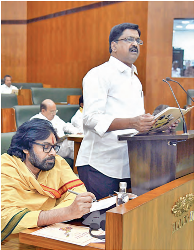
మక్రవారం అసెంబ్లీలో బిల్లుల సమర్పణను రాష్ట్ర ఆర్థికమంత్రి పయ్యసాయి కేశవ్, పక్కన డిప్యూటీ సీఎం పవన్ కల్యాణ్

1-3-2025 శనివారం సంపుటి: 31 సంపుటి: 28 పేజీలు: 08+4 వెల: 6.50