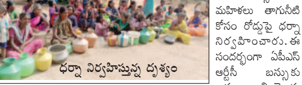
ధర్మా నిర్వహిస్తున్న దృశ్యం