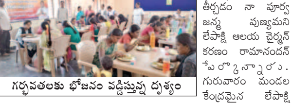
గర్భవతులకు భోజనం వడ్డిస్తున్న దృశ్యం