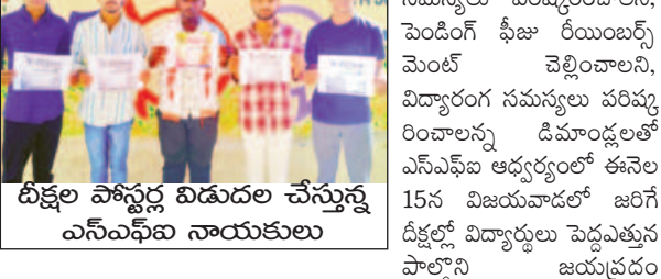
టిక్కుల పోస్టల్ విడుదల చేస్తున్న ఎన్ఎఫ్ఐ నాయకులు

- పోస్టల్ విడుదల చేసిన ఎన్ఎఫ్ఐ నాయకులు ఉరవకొండ, మార్చి 13 ప్రభాతవార్త