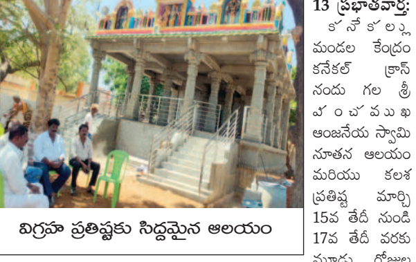
విగ్రహ ప్రతిష్ఠకు సిద్దమైన అలయం

కార్యక్రమము నిర్వహిస్తున్నట్లు ఆలయ సభ్యులు తెలిపారు. కనకలక్ష్మి పరిధిలో ఉన్న కనకలక్ష్మి క్రాస్ లోని రాయదుర్గం రోడ్డు నందు సూతనంగా నిర్మించబడిన శ్రీ వంచముఖ ఆంజనేయస్వామి దేవాలయం నందు మార్చి 15 శనివారం నుండి 17వ తేదీ సోమవారం వరకు సూతన దేవాలయం నందు విశేష పూజలు హోమాలు మూల విగ్రహం అయిన శ్రీ వంచముఖ ఆంజనేయస్వామి ప్రతిష్ఠ కార్యక్రమం మరియూ సర్వ దేవతల ప్రతిష్ఠ కార్యక్రమాల మరియూ ఆలయ రాజగోపురమునకు కలశ ప్రతిష్ఠ మరియూ కుంభాభిషేక ములు నిర్వహించబడును. ఉదయం 10 గంటలకు భక్తులకు అన్న సంతర్పణ కార్యక్రమం నిర్వహిస్తామని భక్తులందరూ ఈ కార్యక్రమాన్ని జయప్రదంగా తమ వంతు సహకారాలు అందించాలని శ్రీ ఆంజనేయస్వామి ఆలయ భక్తజన బృందం వారు తెలిపారు.