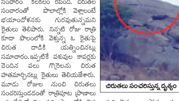
చిరుతుల సంచరస్తున్న దృశ్యం

కంబడూరు మండలం కేంద్రంలోని సిద్దిల గవ్వ కొండ వద్ద వంట పొలాలు సమీపంలో గురువారం చిరుతుల సంచారం కలతలకు దారితీసింది. చిరుతుల సంచారంతో పొలాల్లోకి వెళ్లాలంటే భయాందోళనకు గురవుతున్నందుని రైతులు తెలిపారు. సిన్ తల్లి రోజు తాటి కూడా పొలంలోకి వెళ్తున్న ఓ రైతుకు చిరుతుల దాడికి ఎదుర్కొనినట్లు సమాచారం. ఇప్పటికే పశువుల కాపర్లకు వెందిన వలు గోరెలను చిరుతుల హతమార్చినట్లు రైతులు తెలియజేశారు. మూడు రోజులు నుంచి చిరుతుల సంచరస్తుండడంతో రాత్రిపూట ప్రజాలు అరి చేతిలో పెట్టుకుని పొలాల్లోకి వెళ్తున్నామని రైతులు వాపోతున్నారు. కావున అటవీశాఖ అధికారులు తగిన చర్యలు తీసుకోవాలని వారు కోరారు. సామాజిక మాన్యువల్ వార్డులు ప్రచురించడం అటవీశాఖ అధికారులు సిద్ది గవ్వ కొండ ప్రాంతాన్ని పరిశీలించి రైతులకు ధైర్యాన్ని కల్పించారు.