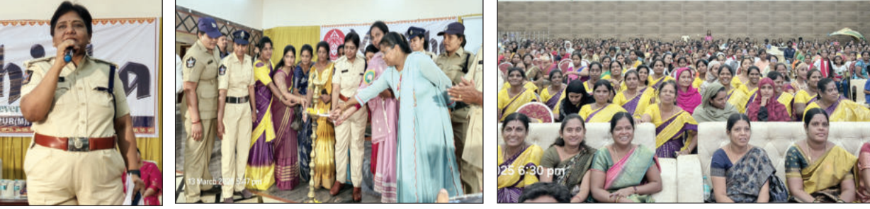
సమావేశంలో మాట్లాడుతున్న జిల్లా ఎస్సీ రత్న, జ్యోతి ప్రజ్వలన చేస్తున్న దృశ్యం, సమావేశానికి హాజరైన మహిళలు

- మహిళా అంటే సమాజంలో ఒక శక్తి - హిందూపురంలో అంతర్జాతీయ మహిళా దినోత్సవ వేడుకలు - హాజరైన ఎస్సీ, జడ్పీ, తదితరులు