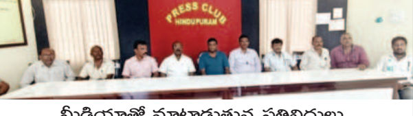
మీడియాతో మాట్లాడుతున్న ప్రతినిధులు

కేబుల్ ఆపరేటర్స్ అసోసియేషన్ హిందూపురం మార్చి 13 ప్రభాతవార్త