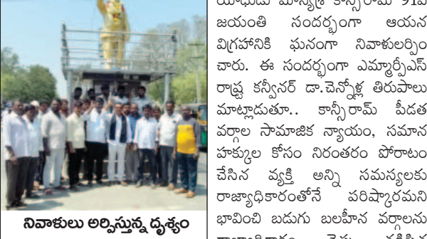
నివాసులు అర్చిస్తున్న డ్యూటీ

అనంతపురం మ్యూజియం, మార్చి 15 ప్రభావవార్త