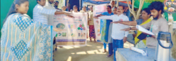
గ్రామాన్ని స్వచ్ఛ గ్రామంగా తీర్చిదిద్దడానికి ప్రతిజ్ఞ చేస్తున్న డ్యూటీ

-కక్కలపల్లి క్లస్టర్ గ్రేడ్ 1 పంచాయతీ కార్యదర్శి యు. హెచ్.ఎం.ఎం.