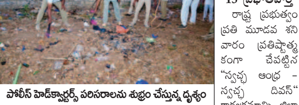
అనంతపురం కలెక్టరేట్, మార్చి 15 ప్రభావవార్త రాష్ట్ర ప్రభుత్వం ప్రతి మూడవ శనివారం ప్రతిష్ఠాత్మకంగా 'స్వచ్ఛ ఆంధ్ర' - స్వచ్ఛ ఆంధ్ర కార్యక్రమాన్ని జిల్లా

ఎన్ఐపి.జి.ఇగిడెమ్ అనేక మేరకు శనివారం జిల్లా హామీ హెల్త్ కార్యక్రమంలో నిర్వహించారు. ఏ.ఆర్ ఆదనపు ఎన్ఐపి ఇలియన్సా తో ఆధ్వర్యంలో ఏ.ఆర్ పోలీసు అధికారులు, సిబ్బంది పాల్గొని పరిసరాలను పరిశుభ్రం చేశారు.