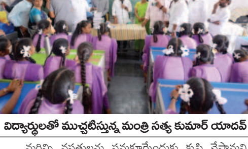
విద్యార్థులతో ముచ్చటపడే మంత్రి సత్య కుమార్ యాదవ్

బత్తలపల్లి, మార్చి 15 ప్రభాతవార్త అభివృద్ధిని మంత్రి సత్య కుమార్ యాదవ్ అభివృద్ధిని మంత్రి సత్య కుమార్ యాదవ్ అభివృద్ధిని మంత్రి సత్య కుమార్ యాదవ్ అభివృద్ధిని మంత్రి సత్య కుమార్ యాదవ్ అభివృద్ధిని మంత్రి సత్య కుమార్ యాదవ్