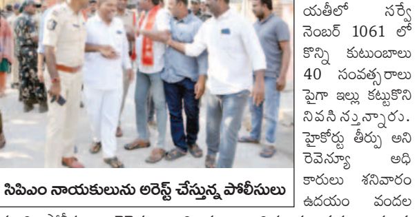
సిపిఎం నాయకులను అరెస్టు చేస్తున్న పోలీసులు

అనంతపురం మార్చి 15 ప్రభావవార్త రూరల్ పరిధిలో ఉన్న పాపం పేట గ్రామ పంచాయతీలో నర్సే వెంకటేశ్వర్లు 1061 లో కొన్ని కుటుంబాలు 40 సంవత్సరాలు పైగా ఇల్లు కట్టుకొని నివసిస్తున్నారు.