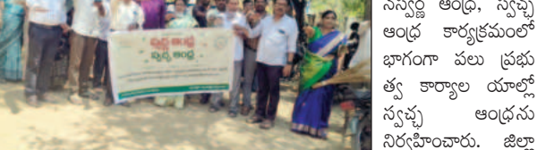
డిఎం అండ్ హెచ్ ఓ కార్యాలయంలో స్వచ్ఛ ఆంధ్ర కార్యక్రమం నిర్వహిస్తున్న డ్యూటీ

అనంతపురం వైద్యం మార్చి 15 ప్రభావవార్త రాష్ట్ర ప్రభుత్వం ప్రతిష్ఠాపకంగా చేపట్టి సస్వచ్ఛ ఆంధ్ర, స్వచ్ఛ ఆంధ్ర కార్యక్రమంలో భాగంగా పలు ప్రభుత్వ కార్యాలయాలలో స్వచ్ఛ ఆంధ్రను నిర్వహించారు.