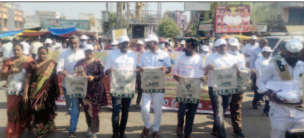
పాత ఉర్రులో ర్యాలీ నిర్వహించి అవగాహన కల్పిస్తున్న కమిషనర,డిప్యూటీ మేయర్లు