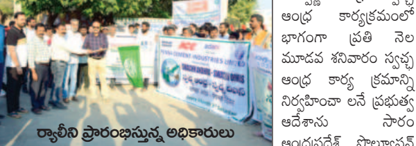
స్వచ్ఛ ఆంధ్ర కార్యక్రమంలో భాగంగా ప్రతి నెల మూడవ శనివారం స్వచ్ఛ ఆంధ్ర కార్యక్రమాన్ని నిర్వహించాలని ప్రభుత్వ అధికారులు సారం ఆంధ్రప్రదేశ్ పాల్యాషన్

స్వచ్ఛ ఆంధ్ర కార్యక్రమం హాజిరైన పలు ఫ్యాక్టరీ ఆసుపత్రిల ప్రతినిధులు అనంతపురం వైద్యం మార్చి 15 ప్రభావవార్త