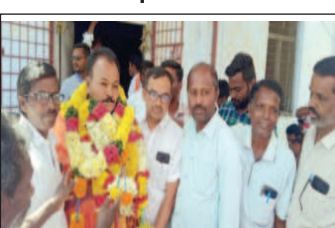
వైయస్.ఆర్.పీ మండల కన్వీనర్ కు ఫీజి పోగు కార్యక్రమంలో భాగం