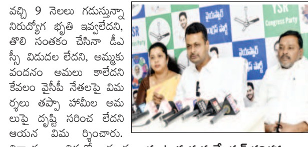
మాట్లాడుతున్న మేయర్ తదితరులు