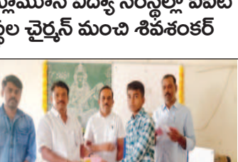
బహుమతులు ప్రధానం చేస్తున్న బియ్యం విద్యా సంస్థల చైర్మన్