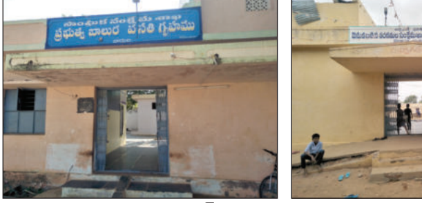
అనంతపురం మ్యూజిమ్, మార్చి 9 ప్రభాతవార్త