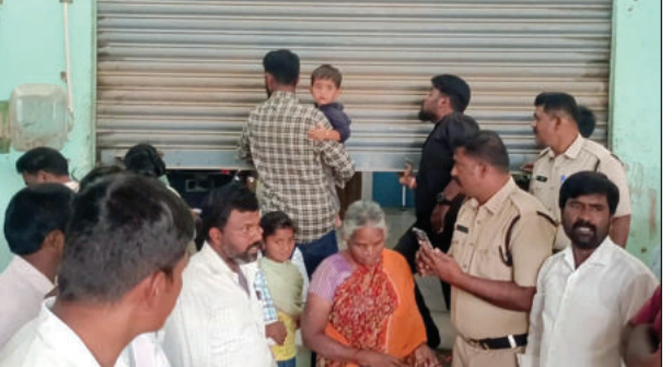
ప్రార్థనా మందిరాన్ని మూసివేయిస్తున్న దృశ్యం

గోరంట్ల మార్చి 9 ప్రభాతవార్త మేము ఏ మతం వారికి వ్యతిరేకం కాదు అయితే ఒక మతానికి సంబంధించిన వ్యక్తుల నివాసాల లేకున్నా మెజారిటీ హిందువుల నివాసాల మధ్య ప్రైవేటు అడ్డ పెద్దత ఎలాంటి అనుమతులు లేకుండా అన్యవేద ప్రవచనాన్ని ప్రోత్సహించే విధంగా ఆ మత ప్రచారకులు డిజైన్డ్ జిల్లాలో సమీప నివాస ప్రాంత ప్రజలను తీవ్ర ఇబ్బందులకు గురి చేస్తున్నారని ఆదివారం గోరంట్ల పట్టణంలో హిందూ సంఘాలు తీవ్రస్థాయిలో మండిపడ్డాయి. గోరంట్ల పట్టణంలోని 1వవార్డు పరిధిలోని చౌడేశ్వరాలాని మెజారిటీ హిందువులు నివసిస్తున్న ప్రాంతంలో ఒక ప్రైవేటు షెడ్యూస్ అద్దెకు తీసుకొని ఇతర ప్రాంతాల నుంచి అన్యవేద ప్రచారకులను తీసుకొచ్చి అనుమతులు లేకుండా మైకులు ఏర్పాటు చేసుకొని సమీప ప్రాంత ప్రజలను ఇబ్బందులకు గురి చేస్తున్నారని మండలానికి చెందిన భారతీయ జనతాపార్టీ, యువమోర్చా, విశ్వహిందూపరిషత్, ఆర్ఎస్ఎస్ సంఘాలు స్థానిక ప్రజల పక్షాన వందలాదిమంది ఆందోళనకు దిగారు. ఇందులో భాగంగా చౌడేశ్వరాలాని ప్రాంతంలో షెడ్యూల్ నిర్వహిస్తున్న ప్రార్థనలను హిందూ సంఘాల వారు అడ్డుకున్నారు. సమాచారం తెలుసుకున్న స్థానిక పోలీసులు అక్కడికి చేరుకొని ఎలాంటి అవాంఛనీయ సంఘటనలు జరగకుండా సర్ది చెప్పారు. అయితే ఈ ప్రాంతంలో మీ మతానికి సంబంధించి ఎన్ని కుటుంబాలు వున్నాయని ఒకటి లేక రెండు మినహా ఏ ఒక్కరూ లేరని అలాంటి సందర్భంలో హిందూ నివాసాల మధ్య ఈ ప్రార్థన మందిరాన్ని అసంధికారికంగా ఏర్పాటు చేయడం ఏమిటని ఇలాంటి చర్యల వల్ల మెజారిటీ