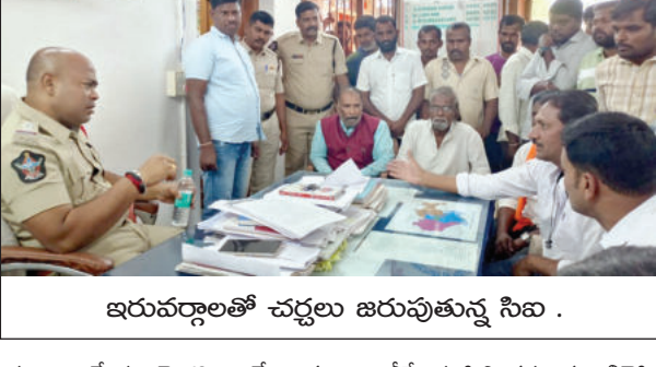
ఇరువర్గాలతో చర్చలు జరుపుతున్న సిబి

గోరంట్ల మార్చి 9 ప్రభాతవార్త మేము ఏ మతం వారికి వ్యతిరేకం కాదు అయితే ఒక మతానికి సంబంధించిన వ్యక్తుల నివాసాల లేకున్నా మెజారిటీ హిందువుల నివాసాల మధ్య ప్రైవేటు అడ్డ పెద్దత ఎలాంటి అనుమతులు లేకుండా అన్యవేద ప్రవచనాన్ని ప్రోత్సహించే విధంగా ఆ మత ప్రచారకులు డిజైన్డ్ జిల్లాలో సమీప నివాస ప్రాంత ప్రజలను తీవ్ర ఇబ్బందులకు గురి చేస్తున్నారని ఆదివారం గోరంట్ల పట్టణంలో హిందూ సంఘాలు తీవ్రస్థాయిలో మండిపడ్డాయి. గోరంట్ల పట్టణంలోని 1వవార్డు పరిధిలోని చౌడేశ్వరాలాని మెజారిటీ హిందువులు నివసిస్తున్న ప్రాంతంలో ఒక ప్రైవేటు షెడ్యూస్ అద్దెకు తీసుకొని ఇతర ప్రాంతాల నుంచి అన్యవేద ప్రచారకులను తీసుకొచ్చి అనుమతులు లేకుండా మైకులు ఏర్పాటు చేసుకొని సమీప ప్రాంత ప్రజలను ఇబ్బందులకు గురి చేస్తున్నారని మండలానికి చెందిన భారతీయ జనతాపార్టీ, యువమోర్చా, విశ్వహిందూపరిషత్, ఆర్ఎస్ఎస్ సంఘాలు స్థానిక ప్రజల పక్షాన వందలాదిమంది ఆందోళనకు దిగారు. ఇందులో భాగంగా చౌడేశ్వరాలాని ప్రాంతంలో షెడ్యూల్ నిర్వహిస్తున్న ప్రార్థనలను హిందూ సంఘాల వారు అడ్డుకున్నారు. సమాచారం తెలుసుకున్న స్థానిక పోలీసులు అక్కడికి చేరుకొని ఎలాంటి అవాంఛనీయ సంఘటనలు జరగకుండా సర్ది చెప్పారు. అయితే ఈ ప్రాంతంలో మీ మతానికి సంబంధించి ఎన్ని కుటుంబాలు వున్నాయని ఒకటి లేక రెండు మినహా ఏ ఒక్కరూ లేరని అలాంటి సందర్భంలో హిందూ నివాసాల మధ్య ఈ ప్రార్థన మందిరాన్ని అసంధికారికంగా ఏర్పాటు చేయడం ఏమిటని ఇలాంటి చర్యల వల్ల మెజారిటీ