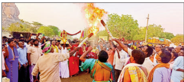
రథం ముందు సంప్రదాయ పూజల నిర్వహిస్తున్న దృశ్యం