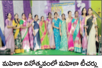
మహిళా దినోత్సవంలో మహిళా టీచర్లు