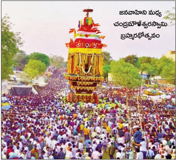
జనవాహినీ మధ్య చంద్రమౌళేశ్వరస్వామి బ్రహ్మరథోత్సవం