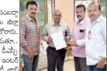
డిజిటల్ వనరులను తొలగించాలి