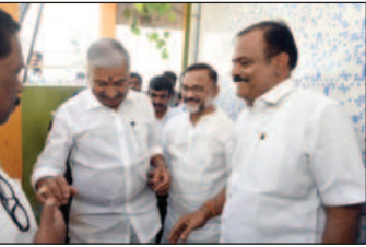
మాజీ మంత్రి పెద్దిరెడ్డి రామచంద్రారెడ్డిని కలిసిన మండల నాయకులు