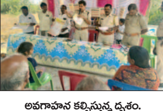
అవగాహన కల్పిస్తున్న దృశ్యం.