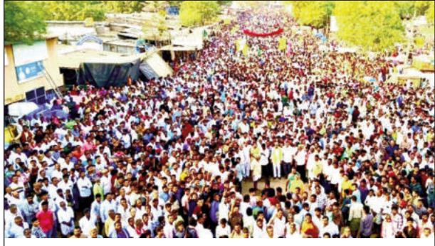
రథోత్సవ కార్యక్రమంలో పాల్గొన్న భక్తజన సందోహం