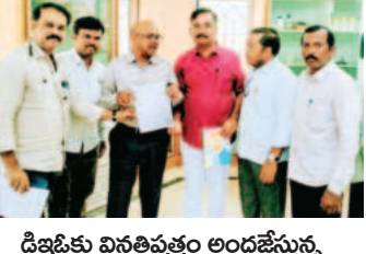
డిజిఐకు వినతిపత్రం అందజేస్తున్న ఎన్టీఆర్ నేతలు