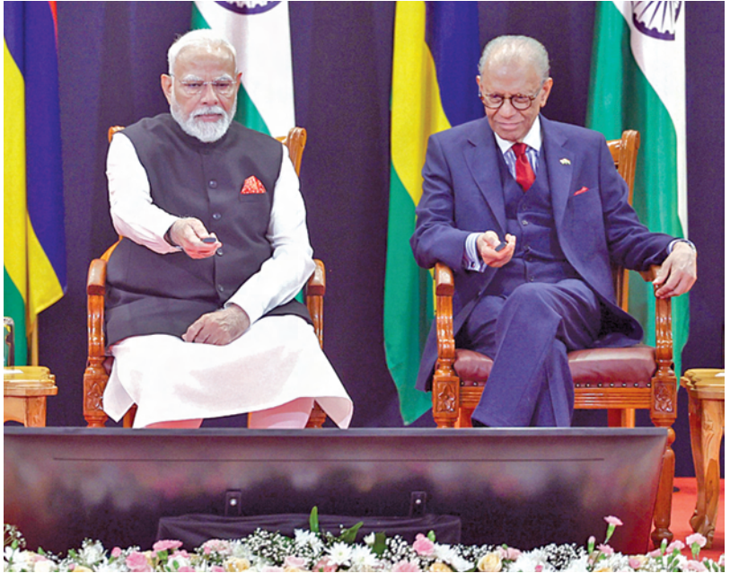
బుధవారం మాలిషీస్ లోని పార్టీ లూయిస్ లో నేషనల్ డే వేడుకల్లో పాల్గొన్న ప్రధాన మంత్రి