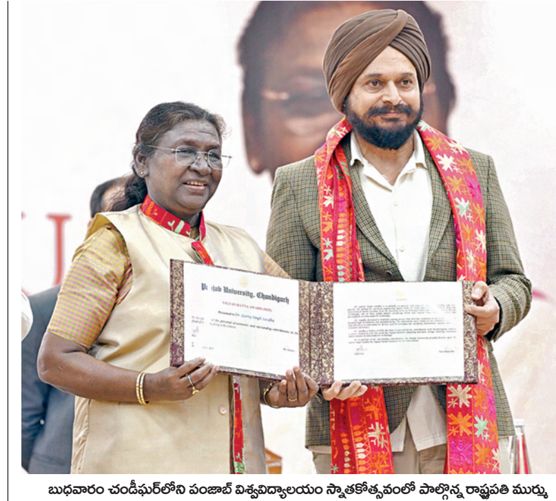
బుధవారం చందీఘర్ లోని పంజాబ్ విశ్వవిద్యాలయం స్నాతకోత్సవంలో పాల్గొన్న రాష్ట్రపతి ముఖ్య

>>> ఖాళీలు వున్నాయన్నారు. ఈ తేడాలను సరిచేసేందుకు కూటమి ప్రభుత్వం చర్యలు ప్రారంభించి దేశాన్ని. ఆంధ్రప్రదేశ్ పబ్లిక్ సర్వీస్ కమిషన్ ద్వారా 138 పోస్టుల భర్తీకి ఇప్పటికే నోటిఫికేషన్ జారీ చేశామని మంత్రి వెల్లడించారు. ఆయనపై ప్రైవేట్ విభాగంలో 72 మంది వైద్యార్థులకు పోస్టుల భర్తీకి నోటిఫికేషన్ జారీ చేయగా దానికి 62 మంది ఇప్పటికే ఎంపికయ్యారని, వారు త్వరలోనే విద్యలో చేరనున్నారని చెప్పారు. హోమియో విభాగంలో 53 పోస్టులకు 52 మంది ఎంపికయ్యారని, యూసీఎ విభాగంలో 26 పోస్టులకు గాను 15 మంది ఎంపికయ్యారని వివరించారు. ఈ విధంగా ఖాళీగా వున్న పోస్టులను భర్తీ చేసి ఈ వైద్య విభాగాన్ని మరింత పటిష్ఠం చేసేందుకు తమ ప్రభుత్వం చర్యలు తీసుకుంటుందన్నారు. అయితే విభాగానికి గత వేద్య కాలంలో కేంద్రం నుండి స్టేట్ యూనివర్స్ యాక్టర్స్ ప్లాన్ కింద రాష్ట్రానికి అందిన నిధులు కేవలం రూ.71 కోట్లు మాత్రమేనని చెప్పారు. కూటమి ప్రభుత్వం అధికారంలోకివచ్చిన మూడు నెలల్లోనే రూ.28 కోట్లు శావీ కింద కేంద్రం నుంచి తీసుకోవడం ద్వారా.