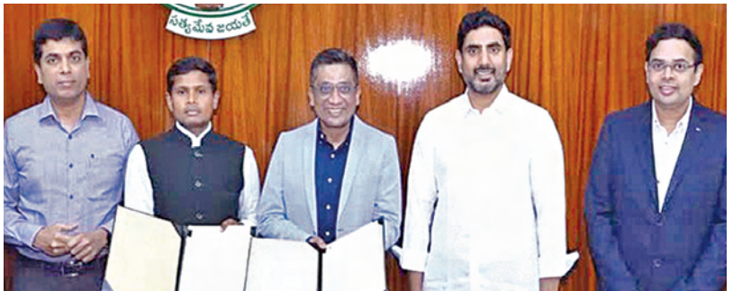
గురువారం మంత్రి లోకేశ్ సమక్షంలో మైక్రోసాఫ్ట్, ఎపిఎస్ఎస్ఐ మరియు ఎంఐఐఎం చీఫ్ కుమారులు, డ్యక్షులు

Published from Guntur, Vijayawada, Hyderabad, Visakhapatnam, Rajahmundry, Nizamabad, Ongole, Warangal, Tirupathi, Kadapa, Kurnool, Anantapur, Karimnagar, Mahabubnagar, Khammam, Nellore, Nalgonda, Tadepalligudem, Srikulakam 14-3-2025 శుక్రవారం సంపుటి: 31 సంపుటి: 41 పేజీలు: 12 వెల: 6.50