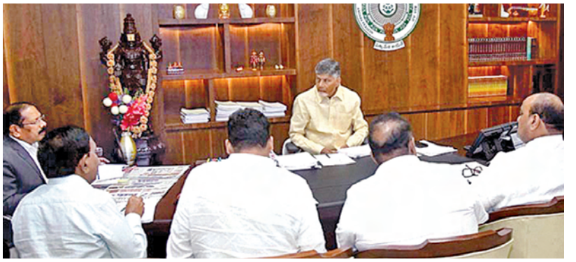
గురువారం ముఖ్యమంత్రి చంద్రబాబు అధ్యక్షతన జరిగిన 4వ ఎస్ఐపిబి సమావేశం డ్యక్షులు

విజయవాడ, మార్చి 13, ప్రభాతవార్త ప్రతినిధి: రాష్ట్ర ప్రభుత్వంపై అత్యంత నమ్మకంతో దిగజే పారిశ్రామిక సంస్థలు పెట్టుబడులకు ముందుకు వస్తున్నాయని ముఖ్యమంత్రి చంద్రబాబునాయుడు తెలిపారు. రాష్ట్రానికి పెట్టుబడుల విషయంలో