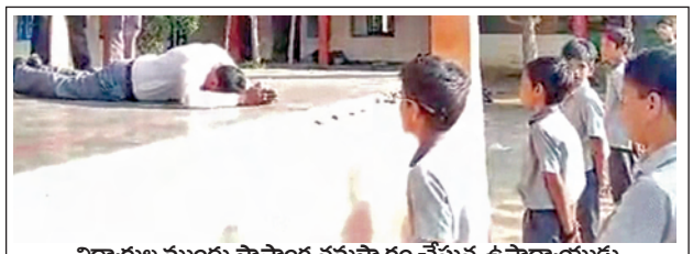
విద్యార్థుల ముందు సాఫ్ట్వేర్ సమస్యలను చేస్తున్న ఉపాధ్యాయుడు