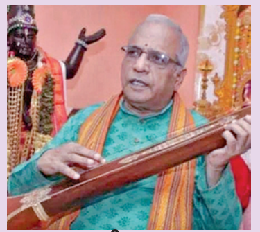
ప్రముఖ సంగీత విద్వాంసుడు గరిమెళ్ల బాలకృష్ణ ప్రసాద్

పాఠశాలకు తరలింపిన 3,45 తరగతులను వెనక్కి తీసుకురానున్నారు. పాఠశాల యాజమాన్య కమిటీ ఆమోదంతో ఏర్పాటు చేసిన ఆదర్శ ప్రాథమిక పాఠశాలల్లో వీటిని విలీనం చేస్తారు. ఆదర్శ పాఠశాల, ఉన్నత పాఠశాలను నిర్ణీత దూరం కంటే ఎక్కువ ఉంటే విద్యార్థులకు నెలకు 600 వాపున 10 నెలల పాటు రవాణా భత్యం చెల్లించనున్నారు. ఒకరు, ఇద్దరు విద్యార్థులున్న ఫౌండేషన్ బడులను సైతం కొనసాగిస్తారు. ప్రాథమిక పాఠశాలల్లో 6,7,8 తరగతుల్లో 30 లోపు విద్యార్థులు ఉంటే వాటిని ప్రాథమిక బడులుగా మార్చు చేయనున్నారు. 6,7,8 తరగతులను మూడు కిలోమీటర్లలోపు ఉన్న ఉన్నత పాఠశాలల్లో విలీనం చేస్తారు. మూడు కిలోమీటర్లలోపు ఉన్నత పాఠశాల లేకపోతే >>2