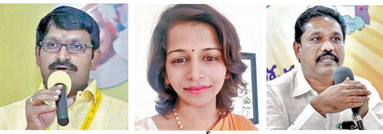
బీద రవిచంద్ర కావలి గ్రీష్మ బిటి నాయుడు