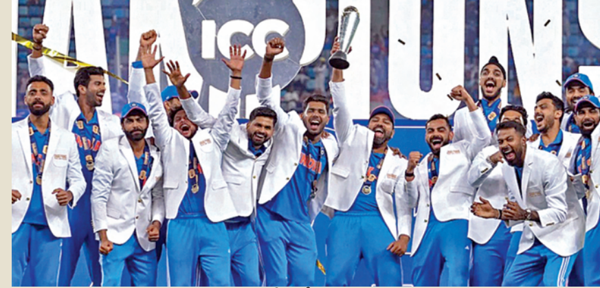
ఐసిసి ఛాంపియన్స్ ట్రోఫీతో టీమిండియా సంబరాలు

ఐసిసి ఛాంపియన్స్ ట్రోఫీ మూడోసారి సాధించిన టీమిండియా నాలుగు వికెట్ల తేడాతో న్యూజిలాండ్పై ఘనవిజయం వరుసగా రెండు ఐసిసి టైటిల్స్ నెగ్గిన రోహిత్ సేన దేశవ్యాప్తంగా క్రికెట్ అభిమానుల సంబరాలు