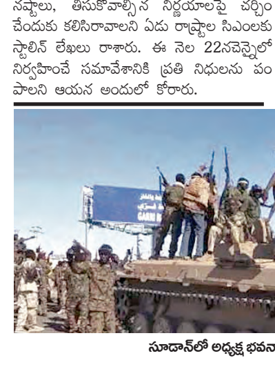
సూడాన్ లో అధ్యక్ష భవనాన్ని స్వాధీనం చేసుకున్న సైన్యం

ఏకగ్రీవంగా వ్యతిరేకిస్తున్నట్లు అఖిలపక్ష సమావేశం తీర్మానించింది. పార్లమెంటు సభ్యుల సంఖ్యను పెంచే పక్షంలో 1971 జనాభా లెక్కల ఆధారంగా ఆయన సభల్లో రాష్ట్రాల మధ్య ప్రస్తుత మున్న నిష్పత్తి మేరకు నియోజకవర్గాల సంఖ్యను పెంచడానికి అవసరమైన రాజ్యాంగ సవరణలు చేపట్టాలని కేంద్ర ప్రభుత్వాన్ని డిమాండ్ చేసింది. ఈ క్రమంలో పునర్విభజన పట్ల జరిగే చర్యలు, తీసుకోవాల్సిన నిర్ణయాలపై చర్చించేందుకు కలిసిరావాలని ఏడు రాష్ట్రాల సిఎలకు స్టాలిన్ లేఖలు రాశారు. ఈ నెల 22న చెన్నైలో నిర్వహించే సమావేశానికి ప్రతి నిధులను పంపాలని ఆయన అందులో కోరారు.