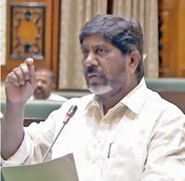
చారు. తర్వాత వచ్చే ప్రభుత్వానికి దక్కాల్సిన అదాయాన్ని కూడా ముందే తీసుకున్నారని మండిపడ్డారు. కెసిఆర్ నెరవేర్చే హామీలు ఇచ్చి ప్రజల్ని మోసం చేశారని తీవ్ర స్థాయిలో ధ్వజమెత్తారు. బిఆర్ఎస్ ప్రభుత్వం పదేళ్లలో రూ.16.70లక్షల కోట్లు ఖర్చు చేయలేదని పూర్తి చేయలేదని చెప్పారు. >>2

విషయాలు స్వయంగా కాగ్ బయటపెట్టిందని పేర్కొన్నారు. గత ప్రభుత్వం ఏనాడూ నిధులను పూర్తిగా ఖర్చు చేయలేదు. భారీగా బడ్జెట్ పెట్టినా నిధులను పూర్తిగా ఖర్చు చేయలేదన్నారు. 2016-17లో రూ.8వేల కోట్లు, 2018-19లో రూ.40వేల కోట్లు, 2021-22లో రూ.48వేల కోట్లు, 2022-23లో రూ.52వేల కోట్లకు సైగా. 2023-24లో రూ.58,571 కోట్లు ఖర్చు చేయలేదన్నారు. ఓఆర్ఆర్‌ను రూ.7వేల కోట్లకే 30 ఏళ్లకొరకు అమ్ముకున్నారని, డొడ్డిదారిన ఓఆర్ఆర్ ప్రభుత్వ భూములను అమ్ముకున్నారని ఆరోపించారు.