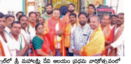
ఘనంగా శ్రీ మహాలక్ష్మి దేవి ఆలయం ప్రధమ వార్షికోత్సవం