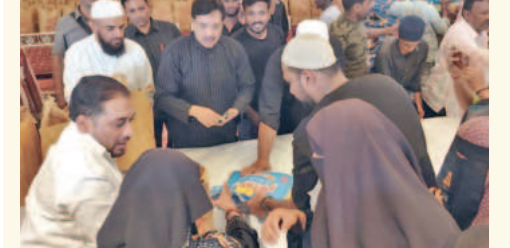
ప్రజలకు సేవ కోసం అందరూ కలిసి ఎమ్మెల్యే బలాల