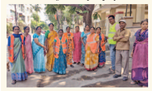
కాలనీలను పరిశుభ్రంగా ఉంచాలి కార్యకర్తల బృందానికి హామీ