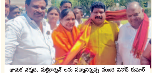
భావన నిరూపణ, మౌనానికి లన సామరస్యాల వంశం విస్తృత కుమార్