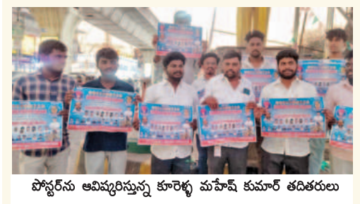
పోస్టల్ అవినీతిని పోషించే టాకీస్ కుమార్ తదితరులు