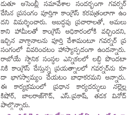
మంత్రి బి.కె.కార్జున్ ద్వారా ప్రజా సమస్యలు పరిష్కరించేందుకు కృషి

ప్రజా సమస్యలు పరిష్కరించేందుకు కృషి. ప్రజా సమస్యలు పరిష్కరించేందుకు కృషి.