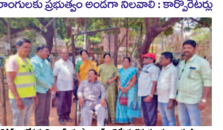
వికలాంగులకు ప్రభుత్వం అందగా నిలవాలి: కార్యకర్తలు