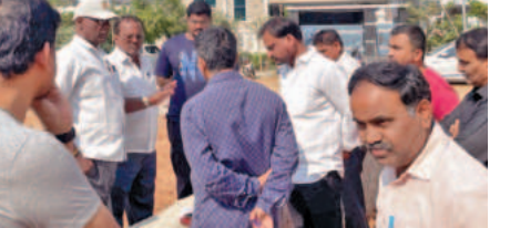
పార్కులు కట్టించే వారిని చర్యలు తీసుకోవాలి