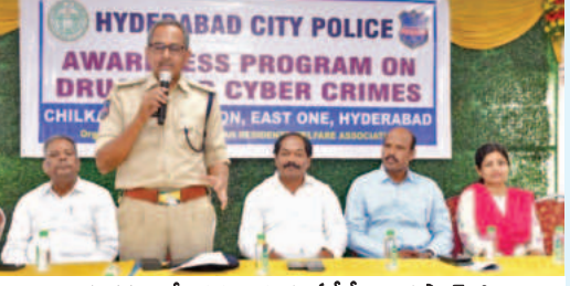
కార్యక్రమంలో ప్రసంగిస్తున్న ఎ.వి.వి. జయప్రకాశ్

బెంగుళూరులో ప్రభుత్వ పోలీసుల కార్యక్రమంలో ప్రసంగిస్తున్న ఎ.వి.వి. జయప్రకాశ్. ఆంధ్రప్రదేశ్ పోలీసుల అభివృద్ధి కోసం అనేక చర్యలు చేపట్టారు.