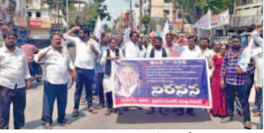
గర్భా నిర్వహణను ఎమ్మార్వీఎస్ నేతలు

ఎన్సీ వర్గీకరణ చట్టాన్ని అసెంబ్లీలో ఆమోదించి. అసెంబ్లీలో చట్టాన్ని ఆమోదించి. అసెంబ్లీలో చట్టాన్ని ఆమోదించి.