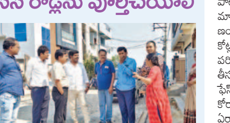
వీలైనంత త్వరగా సిని రోడ్లను పూర్తిచేయాలి