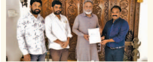
మల్లపల్లె పరిశుభ్రత కమిషన్, డైరెక్టర్ ట్రీడెంట్ విజయ్ వల్లం