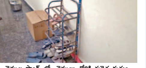
చెప్పుల దొంగల పట్టుకు ఉద్ధారణ కోసం మునురాబాద్ లో చెప్పుల దొంగతనం