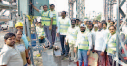
సూత్ర ఫీడర్ ప్రారంభిస్తున్న సిఎండి ముఖారంభణ లిఫ్ట్ ఫార్మాట్

విద్యుత్ సమస్యల తలెత్తకుండా చర్యలు : సిఎండి ముఖారంభణ లిఫ్ట్ ఫార్మాట్. విద్యుత్ సమస్యల తలెత్తకుండా చర్యలు : సిఎండి ముఖారంభణ లిఫ్ట్ ఫార్మాట్.