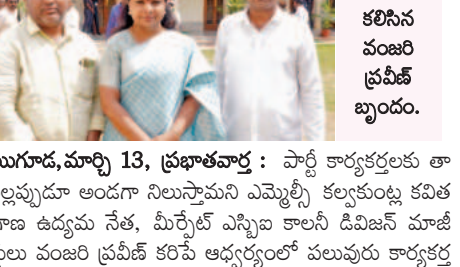
కూర్మలకు ఎల్లప్పుడూ అందగా ఉంటుంది: ఎమ్మెల్యే కవిత