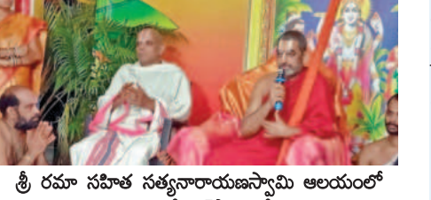
అట్టహాసంగా శ్రీ సత్యదేవుని ఆలయం వార్షిక బ్రహ్మాంచలం