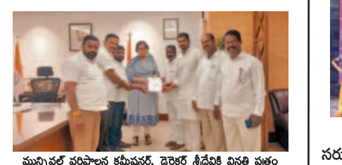
మీరపేట కార్పొరేషన్ లో పెరిగిన ఇంటి పన్నులు తగ్గించాలి