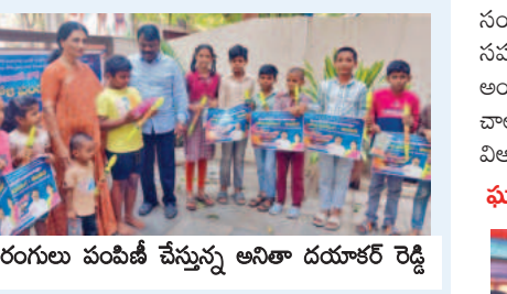
ప్రతి ఒక్కరూ సహజ రంగులు వాడాలి