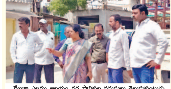
రేవంకొద్ది అయిన వద్ద స్థానికల సమస్యలు తెలుసుకుంటున్న కార్పొరేటర్ కొంతం డివిజన్

కంటోన్మెంట్, మార్చి 21 ప్రభాతవార్త: ప్రజలు ఎదుర్కొంటున్న సమస్యలను సత్వరమే పరిష్కరించే విధంగా చర్యలు చేపట్టాలని ముఖ్యమంత్రి కేసీఆర్ కోరికగా డివిజన్ తెలిపారు. డివిజన్లోని రేవంకొద్ది అయిన వద్ద రోడ్లు, ఎలక్ట్రికల్లు, మర్యాదలను సత్వరమే పరిష్కరించాలని కోరారు. డివిజన్లోని రేవంకొద్ది అయిన వద్ద రోడ్లు, ఎలక్ట్రికల్లు, మర్యాదలను సత్వరమే పరిష్కరించాలని కోరారు.