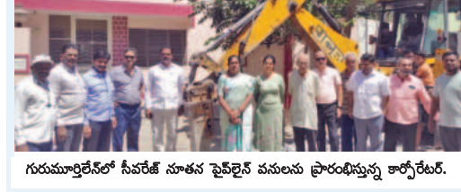
నూతన సీపీఎల్ టైన్ లైన్ పనులు ప్రారంభం కార్యక్రమంలో పాల్గొన్నారు.

జేసపీ అసెంబ్లీలో అసెంబ్లీకి ప్రతిపక్ష వేడుకలు నిజాంపేట, మార్చి 4, ప్రభాకర్ వార్త.