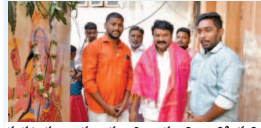
నల్లగొట్ల ముఖ్యార్థి అయిన నిర్మాణానికి భూమి పూజ నిర్వహించు పాల్గొన్న అధికారులు.

భూమి పూజ కార్యక్రమంలో పాల్గొని పాఠశాల ప్రధాని మరియు ఇతర అధికారులు.