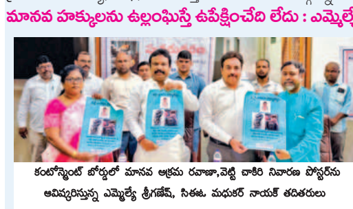
కంటోన్మెంట్ బోర్డులో భాగంగా కార్యక్రమంలో పాల్గొన్నారు.

జేసపీ అసెంబ్లీలో అసెంబ్లీకి ప్రతిపక్ష వేడుకలు నిజాంపేట, మార్చి 4, ప్రభాకర్ వార్త.