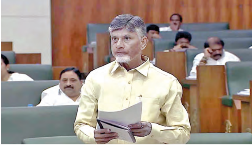
మంగళవారం శాసనసభలో మాట్లాడుతున్న సీఎం చంద్రబాబునాయుడు