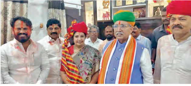
యవాడలో మాజీ ఎంపీ జీవీఎల్ నర్సింహారావు నివాసంలో హోలీ మిలన్ కార్యక్రమంలో కేంద్రమంత్రి అర్జున్ రామ్ మేఘవాల