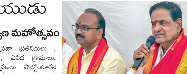
జనరల్ డ్వారా విద్యుత్ సరఫరాకు చర్యలు తీసుకున్నారు. డి.టి.డి నిపునా మరయు భద్రతా విభాగం నుండి 160 మంది, గుంటూరు జిల్లా పోలీస్ యంత్రాంగం నుండి 60 మందితో పటిష్టమైన భద్రత ఏర్పాటు చేసినట్లు తెలిపారు. పోలీస్ వారి సహకారంతో ఐదు డ్రాఫ్టు, 70 సీని వెమరాలు భద్రత, పర్యవేక్షణ కొరకు ఏర్పాటు చేశాం. ఇటీవలే కమాండ్ కంట్రోల్ సెంటర్ ను ఏర్పాటు చేస్తున్నాం. ఆలయం వెనుక వివిధ విభాగాలకు 400 వాహనాలను, ఆలయం కాంపౌండ్ వాల్ వెనుక 1000 వాహనాలకు పార్కింగ్ సౌకర్యం కల్పించాం. అదేవిధంగా సీడ్ యూజీన్ లోడ్ల దక్షిణం వైపు 1500 వాహనాలకు పార్కింగ్ స్థలం కేటాయించాం. శ్రీనివాస కళ్యాణంలో పాల్గొనే భక్తులందరికీ శ్రీవారి సేవకుల సహకారంతో మంచి సేవ, మజ్జిగ, అన్నప్రసాదాలు, అడ్డా ప్రసాదం అందించేందుకు ఏర్పాటు చేశాం. ప్రచార రథాల ద్వారా శ్రీవారి ఆలయం సమీపంలోని 27 గ్రామాలలో ఇంటింటికీ కరపత్రాలు, వార్ పోస్టర్స్ పంపడం జరిగింది.