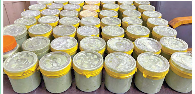
గంజాయి తయారీ చేసిన ఐస్క్రీమ్ బాళ్ళు