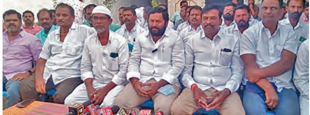
శుక్రవారం మీడియా సమావేశంలో మాట్లాడుతున్న వైఎస్సార్స్ నాయకులు