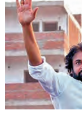
విజయవాడ, మార్చి 14, ప్రభాతవార్త ప్రతినిధి: జనసేన పార్టీ 12వ ఆవిర్భావ దినోత్సవం జరుపుకుంటున్న వేళ ఆ పార్టీ అధినేత పవన్ కల్యాణ్ కు సీఎం చంద్రబాబు అభినందనలు తెలిపారు. పితాపురం నియోజకవర్గంలో

జయశేఖరం సభ ఈ రోజు జరుగుతుంది. ఈ నేపథ్యంలో, ముఖ్యమంత్రి చంద్రబాబు సోషల్ మీడియా వేదికగా స్పందించారు. పవన్ కల్యాణ్ కు, ఆ పార్టీ శ్రేణులకు విషేష తెలిపారు. జన సేనా నిబద్ధత, విలువలతో కూడిన రాజకీయాలకు ప్రతీకగా కొనసాగుతున్న జనసేన పార్టీ 12వ ఆవిర్భావ దినోత్సవం సందర్భంగా ఆ పార్టీ అధినేత పవన్ కల్యాణ్ కు, ముఖ్య నేతలకు, జనసేనకులందరికీ పూర్వపూర్వక శుభాకాంక్షలు అంటూ చంద్రబాబు ఓ ప్రకటనలో పేర్కొన్నారు. ఈ మేరకు తాను, పవన్ కల్యాణ్ కలిసి అభివాదం చేస్తున్న ఘోషాను కూడా పంచుకున్నాడు.