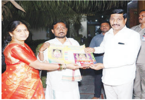
కాలాన్ని దృష్టిలో ఉంచుకుని ఆలయంలో చలువ పందిళ్లు, ప్రత్యేక క్యూలైన్లు ఏర్పాటుచేసి అమ్మవారి దర్శనం త్వరగా అయ్యాలా మదాలని సూచించారు. ఉగాది బ్రహ్మోత్సవాల్లో అమ్మవారిని దర్శనం చేసుకుని అమ్మవారి ఆశీర్వాదాలు పొందాలని సూచించారు.