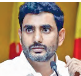
మంత్రి నారా లోకేశ్

విజయవాడ, మార్చి 12, ప్రభాతవార్త ప్రతినది: ఫీజు రీయంబర్స్ మెంట్ బకాయిలు చెల్లించాలని కోస్తా కళాశాలలు విద్యార్థులపై ఒత్తిడి చేస్తున్నట్లు "ఎక్స్" వెబ్ సైట్ లో మంత్రి నారా లోకేశ్ పోస్ట్ చేశారు. ఈ విషయంపై విద్యార్థులకు ఒత్తిడి చేయొద్దని వాటిని తగ్గించాలని కోరారు. ఈ విషయంపై విద్యార్థులకు ఒత్తిడి చేయొద్దని వాటిని తగ్గించాలని కోరారు. ఈ విషయంపై విద్యార్థులకు ఒత్తిడి చేయొద్దని వాటిని తగ్గించాలని కోరారు.