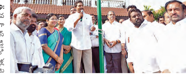
వైఎస్సార్ సిపి అవిర్భావ దినోత్సవం సందర్భంగా పతాక అవిష్కరణ అనంతరం మాట్లాడుతున్న జగన్

విజయవాడ మార్చి 12 ప్రభాతవార్త ప్రతినది: వైఎస్సార్ సిపి అవిర్భావ దినోత్సవం సందర్భంగా పార్టీ అధినేత వైఎస్ జగన్ మోహన్ రెడ్డి బహు మోక్షాని శివ గురయ్యారా. ఇన్నోవేట్ ప్రయాణంలో తన వెంట నడిచిన ప్రతి ఒక్కరికీ కృతజ్ఞతలు తెలియజేస్తూ ఆ సందేశం మిడుతూ