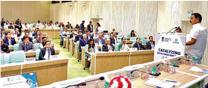
సభలో మాట్లాడుతున్న కేంద్ర ఉక్కు భారీ పరిశ్రమ శాఖ సహాయ మంత్రి భూపతిరాజు శ్రీనివాసవర్మ

లోకేశ్ గుర్తు చేశారు. గత ప్రభుత్వ విధానాన్ని మార్చి ఇప్పుడు ఫీజులు నేరుగా కళాశాలలకు చెల్లిస్తున్నట్లు మంత్రి లోకేశ్ స్పష్టం చేశారు. ఈ విషయంపై విద్యార్థులకు ఒత్తిడి చేయొద్దని వాటిని తగ్గించాలని కోరారు. ఈ విషయంపై విద్యార్థులకు ఒత్తిడి చేయొద్దని వాటిని తగ్గించాలని కోరారు.