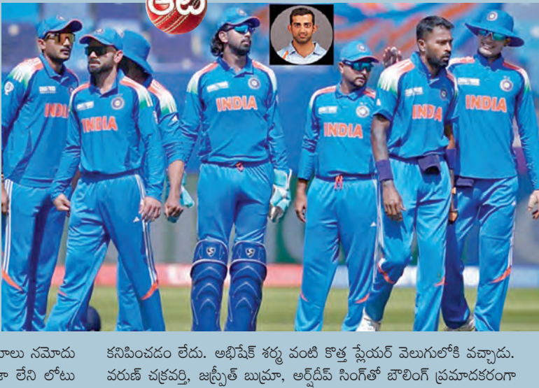
కనిపించడం లేదు. అభీషేక్ శర్మ వంటి కొత్త స్టేయర్ వెలుగులోకి వచ్చాడు. వరుణ్ చక్రవర్తి, జస్టిత్ బుష్లా, అర్చిషిర్ సింగ్ లాంటి ప్రమాదకరంగా

న్యూఢిల్లీ: రాబోయే రెండేళ్లలో భారత క్రికెట్లో కీలక మార్పులు జరగనున్నాయి. ఇదే సమయంలో మూడు ఆలివ్ డ్రెస్ల సవాళ్లు కూడా ఎదుర్కోవాల్సి రానుంది. ఈ నేపథ్యంలో గంభీరకు అసలు ఆట ఇప్పుడే మొదలైంది. గతే దాది జులైలో రాహుల్ ద్రవిడ్ రిటైర్ అయ్యాక గంభీర ప్రధానకోచ్ గా బాధ్యతలు స్వీకరించాడు. ఈ ఎసిమిడి నెలల్లో ఛాంపియన్స్ ట్రోఫీ వంటి అద్భుత విజయాలతో పాటు, రఫీకాన్ మైన్ టెస్ట్ ఓటములు ఉన్నాయి. అయితే ఇప్పటివరకు కోచ్ గంభీర మొదటి దశ ముగిసింది. గంభీరకి నిజమైన పరీక్ష ఇప్పుడే ప్రారంభమవుతోంది. ప్రధానంగా ఇంగ్లండ్లో రాబోయే టెస్ట్ సిరీస్, భారత్ శ్రీలంకలో 2026 టీ20 ప్రపంచ కప్, దక్షిణాఫ్రికాలో 2027 వన్డే ప్రపంచ కప్కు సంబంధించి కీలక మార్పులు, నిర్ణయాలు తీసుకోవాల్సిన అవసరం ఉంది. గంభీర ఇప్పటికే సూర్యకూమార్ యాదవ్ నేతృత్వంలో బలమైన గి20 జట్టును నిర్మించాడు. ఎటాకింగ్ స్టైల్లో జట్టు అద్భుత విజయాలు నమోదు చేస్తోంది. దీంతో రోహిత్ శర్మ, విరాట్ కోహ్లా, రవీంద్ర జడేజా లేని లోటు