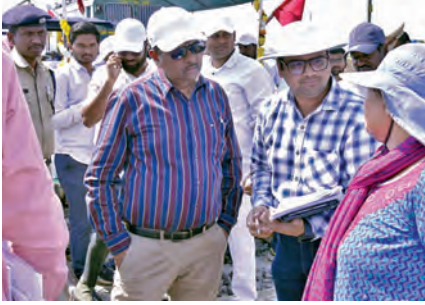
గుంతకల్లు రైల్వే, మార్చి 12, ప్రభాతవార్త ప్రతినది: మధ్య రైల్వే గుంతకల్లు డివిజన్ లో రైల్వే కార్యకర్తలకు ఎలాంటి అంతరాయం ఏర్పడకుండా, రైల్వే నిర్వహణ సజావుగా సాగేందుకు కొత్తగా నిర్మించిన బైపాస్ రైలు