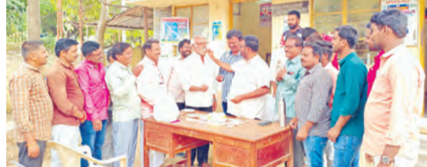
లైన్ మేన్ల దినోత్సవాన్ని నిర్వహిస్తున్న దృశ్యం