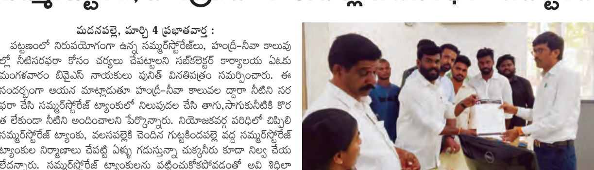
మదనపల్లె, మాల్వి 4 ప్రభాతవార్త :