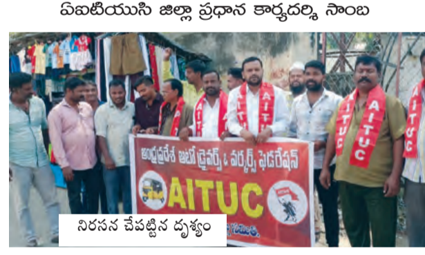
నిరసన చేపట్టిన దృశ్యం