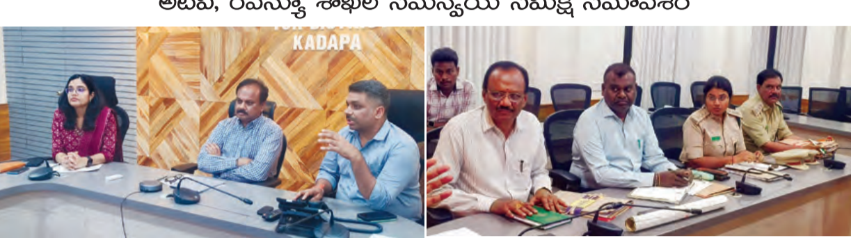
కడప మాల్వి 4 ప్రభాతవార్త:

అటవీ, రెవెన్యూ శాఖల సమన్వయ సమీక్ష సమావేశం