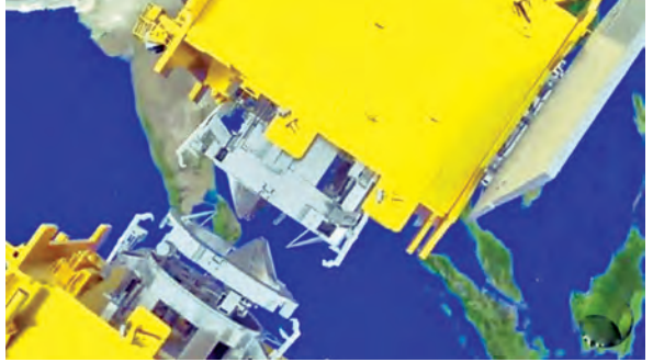
షాన్ నుంచి ప్రయోగించిన స్పేడ్-1 ఉపగ్రహాల అంతరిక్షంలోకి చేరినప్పటి బిత్తం

అమెరికా, రష్యా, చైనాల తర్వాత మనమే శ్రీహరికోట (తరు), మార్చి 13 ప్రభాతవార్త: ఇన్రో తన పరిశోధనలో మరోసారి సూపర్ అసిస్టెంట్ కు గత ఏడాది డిసెంబర్ 30న మన తెలుగు నేల శ్రీహరికోట నుంచి పిఎన్ఎల్ఎస్-60 రాకెట్ ద్వారా ప్రయోగించిన రెండు స్పేస్ డెక్స్ ఉపగ్రహాల అన్ డాకింగ్ ప్రక్రియ విజయవంతంగా పూర్తి చేసుకుంది. 56 రోజుల పరిశోధనల తర్వాత గురువారం ఈ ఘనత ఇన్రో సొంతమైంది. రాకెట్ ప్రయోగం జరిగిన అనంతరం రెండు ఉపగ్రహాలను ఒక్క చోటికి చేర్చడం, వాటి అనుసంధానం, అనంతరం మళ్ళీ విడిపోయి కక్ష్యకు చేరడం వంటి పరిశోధనలు ఇన్రో శాస్త్రవేత్తలు ఇన్ని రోజులుగా చేపట్టారు. భూకేంద్రాల నుంచి ఈ కార్యక్రమం కొనసాగించారు. ఇన్రోకు చెందిన వివిధ సెంటర్లతో పాటు మనకు సమీపంలోని కొన్ని అంతరిక్ష పరిశోధన భూకేంద్రాల సహకారం కూడా తీసుకున్నారు. గురువారం ఈ అన్ డాకింగ్ కార్యక్రమం విజయవంతమై ఉపగ్రహాల కక్ష్యలను తయారు చేసిన దృశ్యాలను అన్ డాకింగ్ కెమెరాలు చిత్రీకరించాయి. ఈ అన్ డాకింగ్ దృశ్యాలు ఇన్రో వెబ్సైట్ లో విడుదల చేసింది. కేంద్రంలోని జియోస్పేస్ ఇన్రో శాస్త్రవేత్తలను అభినందించారు. భవిష్యత్లో భారత అంతరిక్ష పరిశోధనలు, కీలక ప్రయోగాలకు ఇది ఎంతో ఉపయోగపడుతుందని ఆయన పేర్కొన్నారు. గత ఏడాది డిసెంబర్ 30న శ్రీహరికోటలోని సతీష్ ధవన్ అంతరిక్ష కేంద్రం నుంచి పిఎన్ఎల్ఎస్-60 రాకెట్ ద్వారా స్పేడ్-1, స్పేడ్-2 ఉపగ్రహాలను ఇన్రో అంతరిక్షంలోకి పంపింది. 440 కిలోగ్రాముల బరువైన ఈ ఉపగ్రహాలను కొంచెం దూరంగా కక్ష్యలోకి రాకెట్ ప్రవేశపెట్టింది. అప్పటి