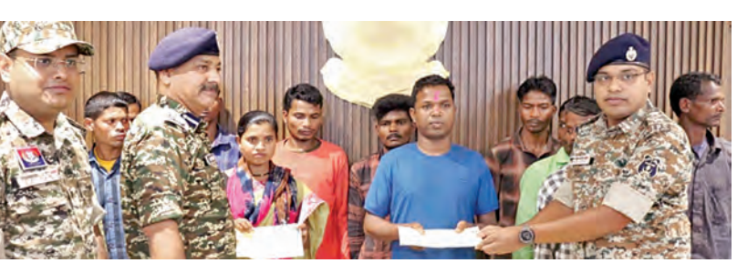
బీజాపూర్ జిల్లాలో లొంగిపోయిన 17 మంది మావోయిస్టులు

హైదరాబాద్, మార్చి 13 ప్రభాతవార్త: హైదరాబాద్ లోని అపార్ట్ మెంట్ లో నాలుగేళ్ల బాలుడు ప్రాణాలు బలిగొంటున్నాయి. తాజాగా బుధవారం రాత్రి అసిస్టెంట్ పోలీస్ స్టేషన్ వద్ద పరిశోధన గర్భిణీ కాలనీలో ముజాబా అపార్ట్ మెంట్ లిప్ట్ లో ఇరుకుని నాలుగున్నరేళ్ల చిన్నారి మృతి చెందారు. స్థానికులు తెలిపిన వివరాల ప్రకారం, కామీ బహు దూర నేపాటి నుంచి వచ్చి