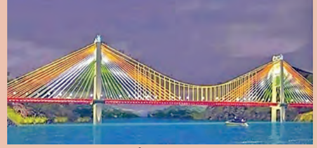
కేబుల్ బ్రిడ్జి సమానా

మహబూబ్ నగర్ జిల్లా, మార్చి 13, ప్రభాతవార్త: నాగిరకర్నూర్ జిల్లా కొల్లాపూర్ లోని సోమశిల పద్మ కృష్ణానదిపై నిర్మించుతున్న కేబుల్ బ్రిడ్జి నిర్మాణ పనుల్లో కడలిక వచ్చింది. ఎట్టకేలకు కృష్ణానదిపై నిర్మించే బ్రిడ్జికి కేంద్రం ఆమోదం తెలిపింది. ఈనెల 15న బ్రిడ్జి నిర్మాణానికి బెండ్రుకూరు కాన్క్రెట్ టెలిసిండ్, రెండు తెలుగు రాష్ట్రాల మధ్య దూరాన్ని తగ్గించేందుకు కేంద్ర ప్రభుత్వం చేపట్టిన 167వ జాతీయరహదారిని నిర్మాణ పనులు వేగంగా కొనసాగుతున్నాయి. ఈ క్రమంలో బ్రిడ్జి బెండ్రుకూరు ప్రక్కం కూడా పూర్తయితే రెండు రాష్ట్రాల మధ్య దూరం తగ్గడంతో పాటు అద్భుతమైన పర్యాటక కేంద్రంగా కూడా కేబుల్ బ్రిడ్జి నిలువనున్నది. తెలంగాణ -ఆంధ్ర ప్రదేశ్ రాష్ట్రాల మధ్య దూరాన్ని తగ్గించి, ప్రమాదాలను నివారించే లక్ష్యంతో కేంద్ర ప్రభుత్వం సోమశిల కృష్ణానదిపై నిర్మించు తలపెట్టిన సస్పెన్షన్ బ్రిడ్జి నిర్మాణం అంతంపై మళ్ళీ కడలిక మొదలైంది. తెలంగాణ, ఆంధ్ర రాష్ట్రాల మధ్య కృష్ణానది ఉండడం వల్ల ఈ రెండు రాష్ట్రాల మధ్య ప్రజలు రాకపోకలు సాగించాలంటే చిన్నచిన్న వడవల ద్వారా ప్రయాణం చేయాల్సి ఉంది. తేసిఎడల అచ్చంపేట, కొల్లాపూర్, నియోజకవర్గాల ప్రజలు మహబూబ్ నగర్, వనపర్తి జిల్లాల మీదుగా బయలుదేరి కర్నూలు మీదుగా వారి వారి గమ్య స్థానాలను చేరాల్సి ఉంటుంది. అయితే ఇది