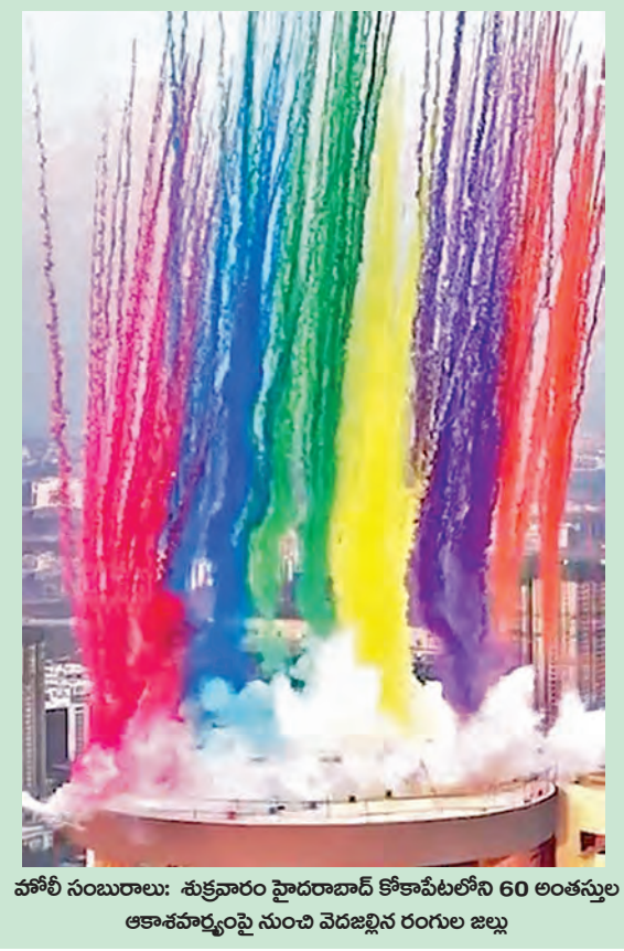
వశోతి సంఘాలు: శుక్రవారం హైదరాబాద్ కోకాపేటలోని 60 లక్షల సంఖ్య ఆకాశవర్షంపై నుంచి వెదజల్లిన రంగుల జల్లు

ప్రతి రైతుకు ప్రత్యేక ఐడి కార్డు మూడేళ్లలో పూర్తికి కేంద్రం నిర్ణయం హైదరాబాద్, మార్చి 14, ప్రభాతవార్త : దేశంలోని ప్రతి రైతుకు ఆధార్ కార్డు మాదిరిగానే తనదైన ప్రత్యేకమైన రైతు ఐడి కార్డులు ఇచ్చేందుకు కేంద్రం ఏర్పాట్లు చేస్తోంది. రాజీవ్ మూడు సంవత్సరాలలో ఆరు కోట్ల మంది ఈ కార్డులను పొందనున్నారు. రాష్ట్ర ప్రభుత్వాలు, కేంద్రపాలిత ప్రాంతాలు నిర్వహించే ఈ ఐడిలు, భూమి రికార్డులు, పశువుల యాజమాన్యం, నాటి పంటలు మరియు పొందిన ప్రయోజనాలతో సహా వివిధ రైతు సంబంధిత డేటాకు అనుసంధానించబడతాయి. రైతుల విశ్వసనీయ డిజిటల్ గుర్తింపుగా సేవలందిస్తూ, ఐడి దేశంలోని అగ్రిస్టాకోల్ కీలకమైనదిగా ఉంటుంది కేంద్ర వ్యవసాయ మంత్రిత్వ శాఖ కార్యదర్శి దేవేన్ పటవేది వెల్లడించారు. వ్యవసాయ రంగాన్ని డిజిటలైజ్ చేసే దిశగా ప్రభుత్వం త్వరలో దేశ వ్యాప్తంగా రైతులకు ఆధార్ తరహాలో ప్రత్యేక గుర్తింపు కార్డును అందించేందుకు రిజిస్ట్రేషన్ ప్రక్రియను ప్రారంభించనున్నట్లు తెలిపారు. కనీస మద్దతుదర్ (ఎంఎన్ఎ) మరియు కిసాన్ క్రెడిట్ కార్డ్ ప్రోగ్రామ్ లో సహా >>2