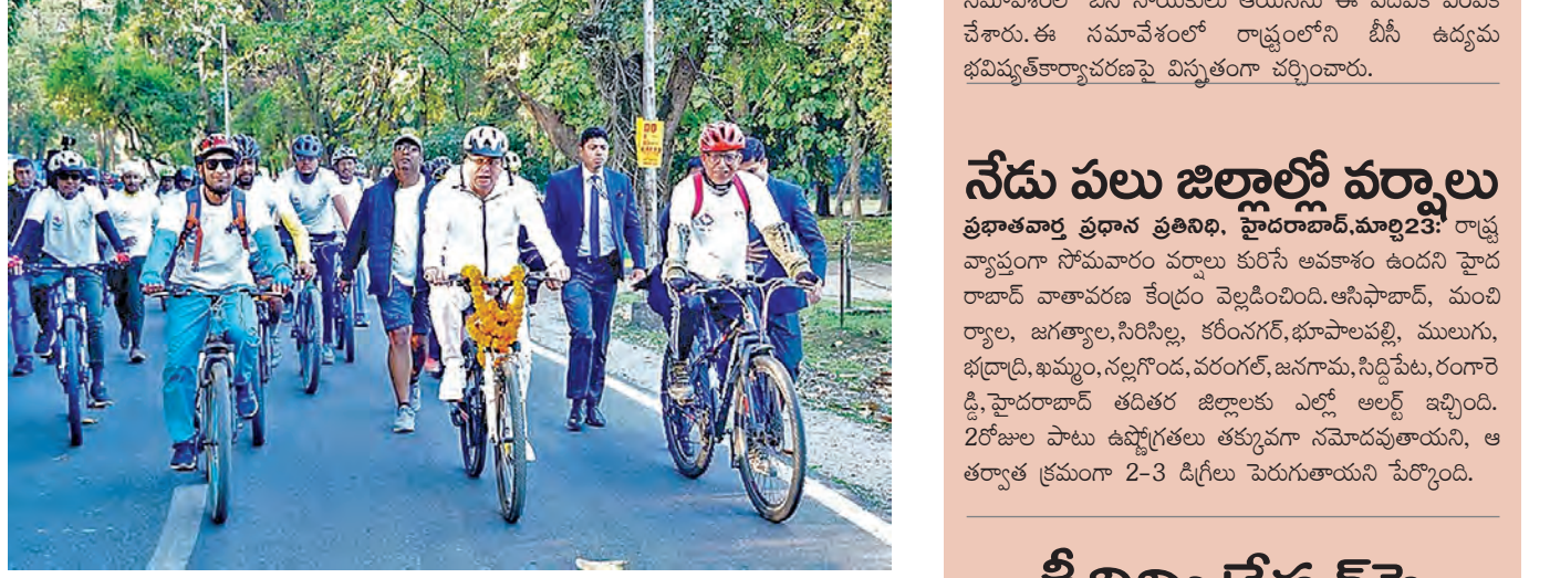
ఉత్తరాఖండ్ రాష్ట్ర సర్కార్ మూడేళ్ల పాలన పూర్తి చేసుకున్న సందర్భంగా ఆదివారం డెహ్రాడూన్ లో నిర్వహించిన సైకిల్ ర్యాలీలో సైకిల్ ట్రోపిన్ ముఖ్యమంత్రి పుష్కర్ సింగ్ ధామి