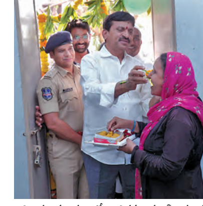
ఆదివారం భద్రాచలంలో ఇందిరమ్మ ఇళ్లదారులకు మిఠాయి తినిపిస్తున్న మంత్రి పొంగులేటి