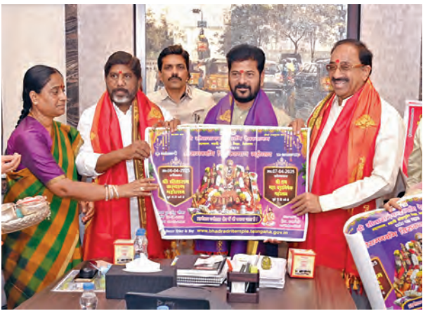
ఆదివారం సిఎం నివాసంలో శ్రీరామనవమి బ్రహ్మాత్మ వాల వాల్పోస్టర్స్ ఆవిష్కరణను ముఖ్యమంత్రి రేవంత్ రెడ్డి, డిప్యూటీ సీఎం భట్టి, మంత్రులు కొండా సురేఖ, తుమ్మల నాగేశ్వరరావు