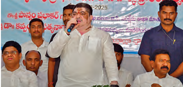
ఆదివారం తిమ్మాపూర్లోని రవాణా శాఖ కార్యాలయంలో మాట్లాడుతున్న మంత్రి పాన్వం ప్రభాకర్

నూతన ప్రాజెక్ట్ పాలీ విధానం ద్వారా 15 సంవత్సరాలు దాటిన వాహనాల స్టాంప్ లో కోట్ల వాహనాలు కొనుగోలు చేసే రాయితీ ఇస్తామని తెలిపారు. కాలవ్యవస్థ నివారణకు దేశంలోనే మొదటిసారిగా ఎలక్ట్రిక్ వెహికల్ పాలీసీని తీసుకొచ్చామని అన్నారు. ప్రజలను ప్రమాదాల నుండి రక్షించేందుకు అన్ని చర్యలు తీసుకుంటున్నామని తెలిపారు. తిమ్మాపూర్ లోని ట్రాఫిక్ పార్క్ విద్యార్థులందరూ సందర్శించి రోడ్డు భద్రత నియమాలపై అవగాహన పెంచుకోవాలని సూచించారు. ప్రతి పాఠశాల విద్యార్థి ఈ పార్కును సందర్శించేలా చూడాలని ఆధికారులను ఆదేశించారు. తెలంగాణలో ప్రమాదాల నివారణకు ప్రభుత్వం అనేక రోడ్డు భద్రతాచర్యలను