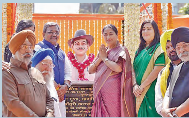
న్యూఢిల్లీలోని మాలవీయ నగర్లో ఆదివారం షహీద్ భగత్ సింగ్ విగ్రహాన్ని ఆవిష్కరించి నివాళులర్పిస్తున్న ఢిల్లీ ముఖ్యమంత్రి రేఖ గుప్తా. చిత్రంలో బిజెపి ఎంపి బహుగౌరవ్ సర్కార్ తదితరులు