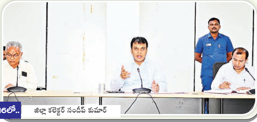
16లో.. జిల్లా కలెక్టర్ సందీప్ కుమార్