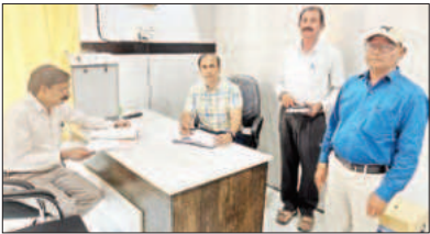
గర్భస్థ శిశు లింగ నిర్ధారణ నిషేధిత చట్టం 1994 ప్రకారంలింగ నిర్ధారణ చేసి పుట్టే పనిపాప