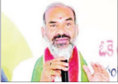
నిన్నటి రోజున జగిత్యాల జిల్లా వేములవాడ

మాటిచ్చిన 12 గంటల్లో రూ.58 లక్షలు మంజూరు చేయించిన ప్రభుత్వ విప్ ఆది శ్రీనివాస్ మేడిపల్లి/భీమారం, ప్రభాతవార్త;