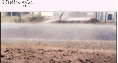
వర్షం వాన కురిసింది. వడగళ్ల వానతో రైతుల పంటలు దెబ్బతిని తీవ్ర నష్టం వాటిల్లింది.

వరకు సూర్యుని తీవ్రతతో ఎంతో వేడి ఉండి ఒక్కసారిగా మబ్బులు కమ్ముకోవడం, ఈడరు గాలులు వీయడంతో ఒక్కసారిగా అంతా చల్ల బడింది. ఉరుములు, మెరుపులతో కూడిన భారీ వర్షం గంటకు పైగా మండలంలో కురిసింది. మండలంలోని వట్టిమల్ల, అజ్జీర తండా, భూక్కరెడ్డి తండా, నిమ్మపల్లి గ్రామాల్లో ఏకంగా