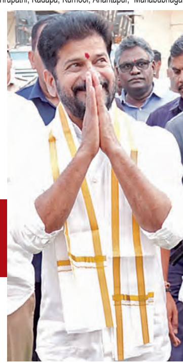
శనివారం కొడంగల్లో ప్రజలకు అభివాదం చేస్తున్న సీఎం రేవంత్