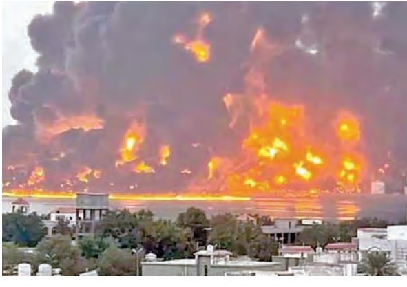
సనా, మార్చి 16: యెమెన్ లోని హాతీలపై అమెరికాలోని ట్రంప్ సర్కారు సైనిక చర్యను మొదలుపెట్టింది. ఎర్ర సముద్రంలో వాణిజ్యనౌకల అక్షయంగా దాడులుచేస్తున్న యెమెన్ తిరుగుబాటుకాలకు ఇక అమెరికా చుక్కలు చూపిస్తోంది. యెమెన్ రాజధాని సనా, సదా, అల్ బైదా, రాదాల్ అక్షయంగా దాడులు కొనసాగించింది. ఇప్పటివరకూ 34 మంది మృతిచెందారని, 101 మంది గాయపడినట్లు హాతీ ఆరోపించింది. మృతుల్లో మహిళలు,