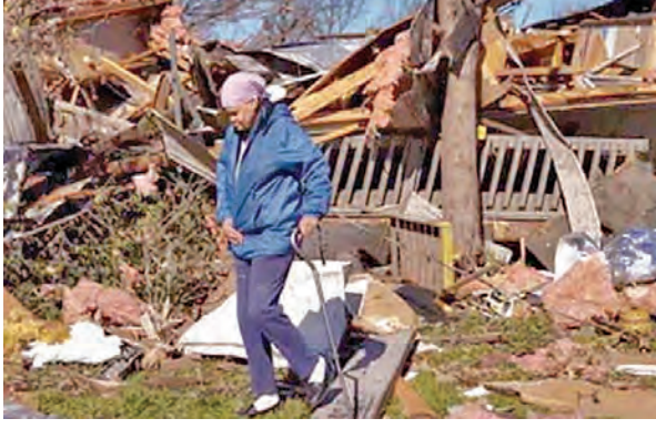
వాషింగ్టన్, మార్చి 16: అగ్రరాజ్యం అమెరికాను భీకర తుపానులు వణికిస్తున్నాయి. పెద్ద ఎత్తున టోర్నాడోలు విరుచుకుపడుతున్నాయి. బలమైన గాలుల కారణంగా అనేక ఇళ్లు నేలమట్టం అయ్యాయి. ఈ తుపాను ధాటికి అమెరికా వ్యాప్తంగా 34 మంది ప్రాణాలు కోల్పోయారు. మిస్సోరి లోని బేకర్స్ ఫీల్డ్ లో టోర్నాడో కారణంగా 12 మంది మృతిచెందారు.

అగ్రరాజ్యం రాష్ట్రంలోని ఇండిమెంట్స్ కౌంటీలో ముగ్గురు పనిపోయారు. ఎనిమిది కౌంటీల్లో 50 మందికిపైగా గాయపడినట్లు అగ్రరాజ్యం అధికారులు చెప్పారు. రాష్ట్ర వ్యాప్తంగా 16 కౌంటీల్లో భారీగా ఆస్తి నష్టం సంభవించినట్లు పేర్కొన్నారు. అనేక ఇళ్లు ధ్వంసం అయినట్లు చెప్పారు. విడ్మిత్ లైన్లు, చెట్లు కూలిపోయాయని పబ్లిక్ సేఫ్టీ విభాగం వెల్లడించింది. గవర్నర్ నారా చుకాబీ శాండర్స్ అత్యవసరపరిస్థితిని ప్రకటించారు. అధ్యక్షుడు ట్రంప్ తో తాను మాట్లాడాలని ప్రజల రక్షణకు చర్యలు తీసుకుంటామని ఆయన హామీ ఇచ్చినట్లు చెప్పారు. టెక్సాస్ పాస్ హ్యూడిల్ లోని అమెరిక్ లో కౌంటీలో దుమ్ముతుపాను కారణంగా జరిగిన కారు ప్రమాదాల్లో ఏడుగురు పనిపోయారు. మరొకరు మిసిసిప్పీలో పనిపోయారు. అమెరికా మొత్తంగా బలమైన గాలులు ప్రభావంపట్టి అనేక ప్రాంతాల్లో పనిపోయారు వారి సంఖ్య అనంతం అవుతుంది. 100కిపైగా అడవుల్లో మంటలు చెలరేగినట్లు తెలిపింది. ముందులోనే సంభవించిన టోర్నాడోల కారణంగా తూర్పు లూసియూనా, మిసిసిప్పీ, అలబామా, పశ్చిమ జార్జియా, ఫ్లోరిడా, పాస్ హ్యూడిల్ ప్రాంతాలు తీవ్రంగా ప్రభావం అయ్యాయి. టోర్నాడోలు పనిచేస్తున్నప్పుడు అవకాశం ఉందని అందులో కొన్ని ప్రమాదకరస్థాయిలో ఉండవచ్చని జాతీయ వాతావరణ సేవ విభాగం హెచ్చరికలుచేసింది. టెక్సాస్, కన్యాస్, డక్షిణ అమెరికా రాష్ట్రాల్లో దీని ముప్పు ఎక్కువగా ఉంటుందని తెలిపారు.