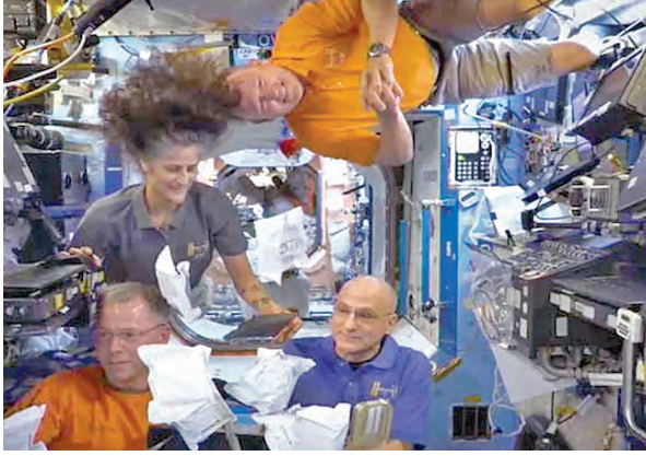
న్యూయార్క్, మార్చి 16: అంతర్జాతీయ అంతరిక్షకేంద్రం ఐఎస్ఎస్ లోనే

జరిగిందని నానా వెల్లడించింది. ఇందుకు సంబంధించిన విడియోను కూడా స్పేస్ఎక్స్ విడుదలచేసింది. సునీతా విలియమ్స్ మరో వ్యోమగామి బుక్ విల్సన్ స్టానల్ తాజాగా అక్కడికి వెళ్లిన నలుగురు వ్యోమగాములు పనిచేయనున్నారు. క్రూడాగన్ వ్యోమనౌక శనివారం తెల్లవారజామున 4.33 గంటలకు అమెరికాలోని కెన్నెడీ అంతరిక్ష కేంద్రం నుంచి ప్రయాణం మొదలుపెట్టింది. క్రూ-10 మిషన్ లో భాగంగా స్పేస్ఎక్స్ కు చెందిన ఫాల్కన్-9 రాకెట్ దీన్ని నింగిలోకి మోసుకెళ్లింది. ఇందులో అమెరికాకు చెందిన ఆన్ మెక్ కైయన్, నికోల్ ఆరుర్స్, జాపన్ వ్యోమగామి ఒకరు యాబిడి, రష్యాకు చెందిన కిరిలోఫెస్కోవ్ ఐఎస్ఎస్ కు చేరారు. వీరికి సునీతా విల్సన్ లు స్వాగతం పలికారు. టెస్ట్ మిషన్ కోసం బోయింగ్ కు చెందిన స్టార్ లైన్ అంతరిక్ష నౌకలో విలియమ్స్, విల్మోరెలు 2024 జూన్ 5న అంతరిక్షంలోకి వెళ్లారు. ఎనిమిదిరోజుల తర్వాత వారు భూమికి రావాల్సి ఉంది. అయితే స్టార్ లైన్ రోస్ స్పేస్ క్రాఫ్ట్ క్రస్టర్స్ మూడుకు పోవడంతోపాటు హీలియం కూడా అయిపోయింది. ఈ సేవత్వంలో వ్యోమగాములను ఈ కార్యక్రమంలో తిరిగి భూమిపైకి తీసుకురావడం సంకీర్ణం కాదని ఆగస్టు నెలారాఖరునాటికి నానా ఒక నిర్ణయానికి వచ్చింది. దీనితో వ్యోమగాములు లేకుండా బోయింగ్ స్టార్ లైన్ 2024, సెప్టెంబరు 7న క్షేమంగా భూమికి తిరిగి వచ్చింది అప్పటినుంచి సునీతా, విల్మోరెలు అంతరిక్షంలోనే ఉండిపోయారు. తిరిగి ఇప్పుడు ఈ నెల 19, 20 తేదీలనాటికి వారు క్రూ-10 క్యాప్సుల్ లోనే తిరిగి భూమికి రానున్నారు.