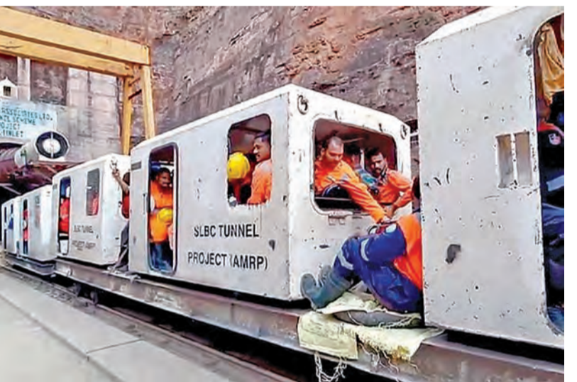
ఎస్ఎల్బీసీ టన్నెల్ వద్ద ఆదివారం కొనసాగిన రెస్ట్రా ఆపరేషన్ దృశ్యం

తెలంగాణ అప్పులు, అభివృద్ధిపై, రాష్ట్రంలో కాంగ్రెస్ చేసిన అభివృద్ధిపై పిల్లకాలంలో కాకుండా డైరెక్టుగా కేసీఆర్ తోనే మాట్లాడతానని సీఎం రేవంత్ రెడ్డి అన్నారు. ఈ సందర్భంగా మాజీమంత్రి హరీశ్ రావుపై తీవ్ర గావిరుచుకుపడ్డారు. కేటీఆర్, హరిశ్చరావు పిల్ల కాకుల