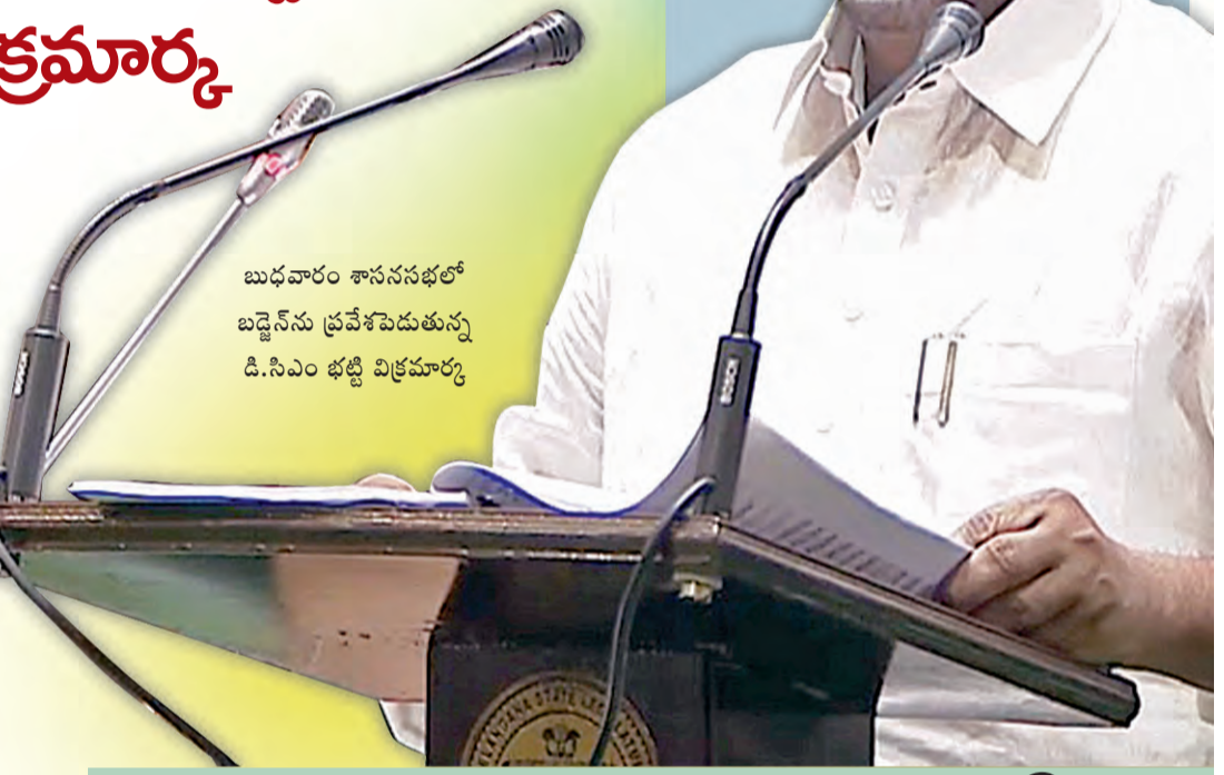
బుధవారం శాసనసభలో బడ్జెట్ను ప్రవేశపెడుతున్న డి.సిఎం భట్టి విక్రమార్కు

హైదరాబాద్, మార్చి 19, ప్రభాతవార్త: తెలంగాణ ఉపముఖ్యమంత్రి భట్టి విక్రమార్కు బుధవారం శాసనసభలో రూ.3,04,965 కోట్ల అంచనా వ్యయంతో తొలిసారి కాంగ్రెస్ ప్రభుత్వం పూర్తిస్థాయి బడ్జెట్ ప్రవేశపెట్టారు. రెవెన్యూ వ్యయం రూ.2,26,982 కోట్లు కాగా, మూలధన వ్యయం రూ.36,504 కోట్లుగా ప్రతిపాదించి శాసనసభ సభ్యుల ఆమోదం కోసం ఆర్థికశాఖ మంత్రి భట్టి విక్రమార్కు సభకు సమర్పించారు. రాష్ట్రం అప్పుడు రూ.5,04,814 కోట్లుగా ఉందని వివరించారు. శాసనసభలో ఉపముఖ్యమంత్రి భట్టి విక్రమార్కు " ప్రజాప్రయోజనాలే ద్యేయంగా, పారదర్శకత, జవాబుదారీతనంతో సాగుతున్న మా ప్రభుత్వం 2025-26 ఆర్థిక సంవత్సరానికి బడ్జెట్ ప్రవేశపెడుతున్నందుకు సంతోషంగా ఉంది. సంక్షేమం-అభివృద్ధిని సమపాళ్లలో రంగించి జోడుగులూ తరహా సుపరిపాలన రక్షాన్ని పరుగులు పెట్టడం-సభలికత అయ్యి మన రాష్ట్ర ప్రజలకు తెలియజేయుచున్నాను" అంటూ బడ్జెట్ ప్రసంగం సీక్రెట్ ఆమోదంతో ఉదయం 11.07 మొదలు పెట్టి మధ్యాహ్నం 12:53 వరకు కొనసాగించారు. "నిజం కూడా ప్రతి రోజూ ప్రచారంలో ఉండాలి, లేదంటే అబద్ధం నిజంగా మారి రాష్ట్రాన్ని, దేశాన్నికాదు ప్రపంచాన్ని కూడా నాశనం చేస్తుంది" అంటూ ఆర్థిక మంత్రి >>2