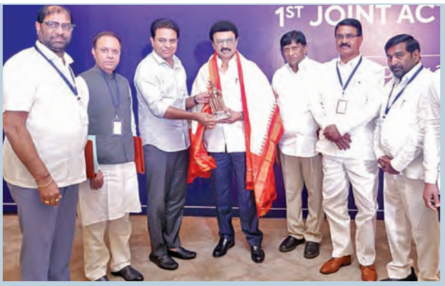
చెన్నైలో శనివారం జరిగిన అఖిల పక్ష భేటీలో తమిళ సీఎం స్టాలిన్ సన్మానిస్తున్న కెటిఆర్. చిత్రంలో బిఆర్ఎస్ నేతలు