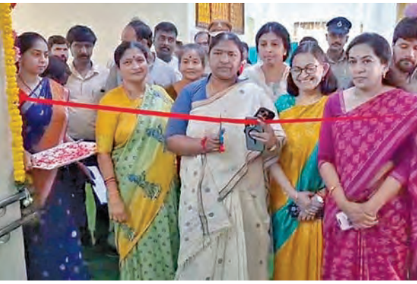
జావెనెల్ హోమల్ డ్రగ్స్ డిఆడిక్షన్ సెంటర్ను ప్రారంభిస్తున్న మహిళా శిశు సంక్షేమ శాఖ మంత్రి సీతక్క