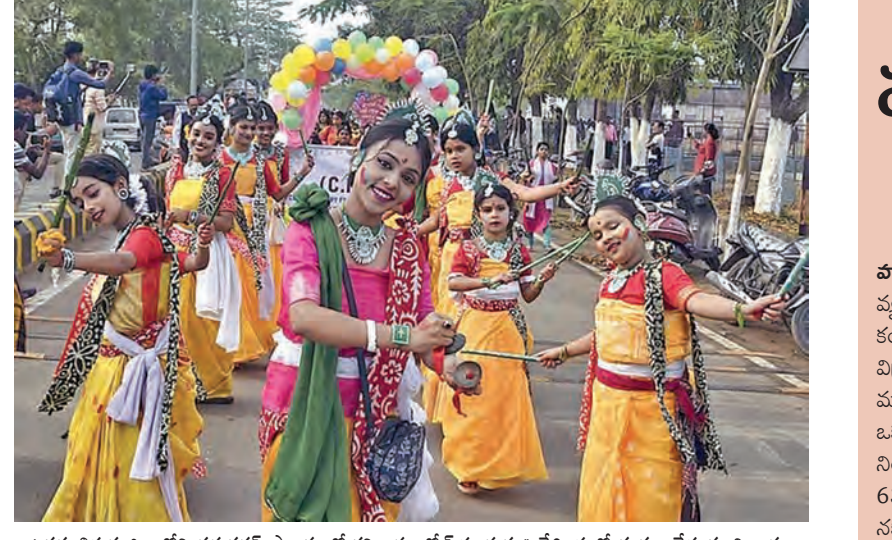
ఉత్తర తీర్చిదిద్ద జిల్లాలోని ధర్మనగర్ ప్రాంతంలో శనివారం డోల్ పండుగ ఊరేగింపులో నృత్యం చేస్తున్న చిన్నారులు