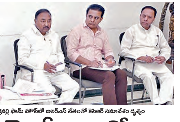
శుక్రవారం అరవైవి ఫ్యామ్ హాసాలో బిఆర్ఎస్ నేతలతో కెసిఆర్ సమావేశం దృశ్యం

పునర్విభజన, త్రిభాషా విధానంపై ఉమ్మడి పోరు 22న చెన్నైలో జిఎస్ టిఎం తమిళ సిఎం స్టాలిన్ పిలుపు చెన్నై, మార్చి 7: త్రిభాషావిధానం అమలు, జాతీయ కొత్త విధానంపై బిజెపియేతర రాష్ట్రాలతో కలిసి సమన్వయ బోధానికి తమిళనాడు ముఖ్యమంత్రి ఎంకె స్టాలిన్ పిలుపునిచ్చారు. కేరళ, కర్ణాటక, తెలంగాణ, పశ్చిమబెంగాల్: చంజాబ్ రాష్ట్రాల ముఖ్యమంత్రులతోపాటు ఓడిశా బిజెడి ఆగ్రెగేషన్ కు కూడా ఈ సమావేశానికి ఆహ్వానించారు. ఒకసంయక్త కార్యచరణ కమిటీ (జిఎస్)గా ఏర్పడాలని, చెన్నైలో ఇందుకోసం ఈనెల 22వ తేదీ ఆరంభ సమావేశం నిర్వహించాలి >>7