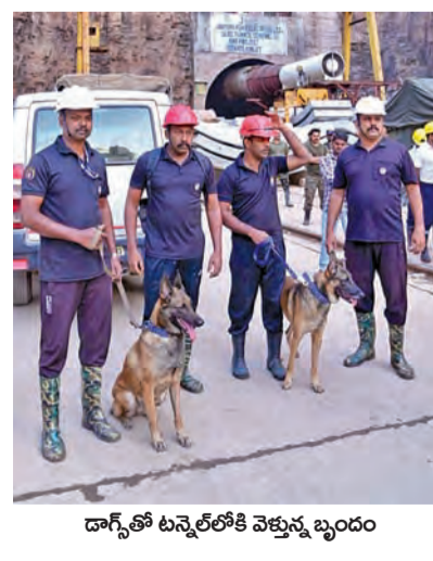
డాగ్స్ తో టన్నెల్లోకి వెళ్తున్న బృందం